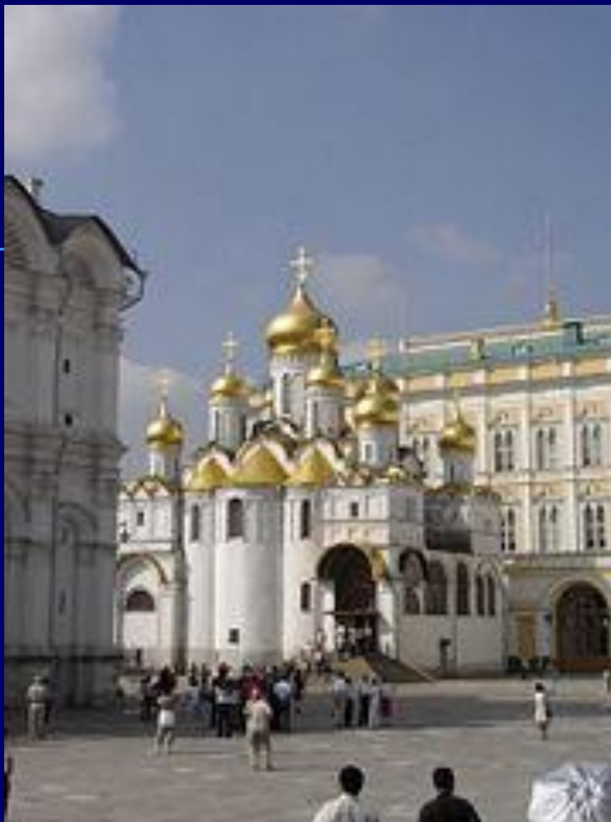
Благовещенский собор Московского кремля

Существует большое количество храмов, посвященных этому празднику.