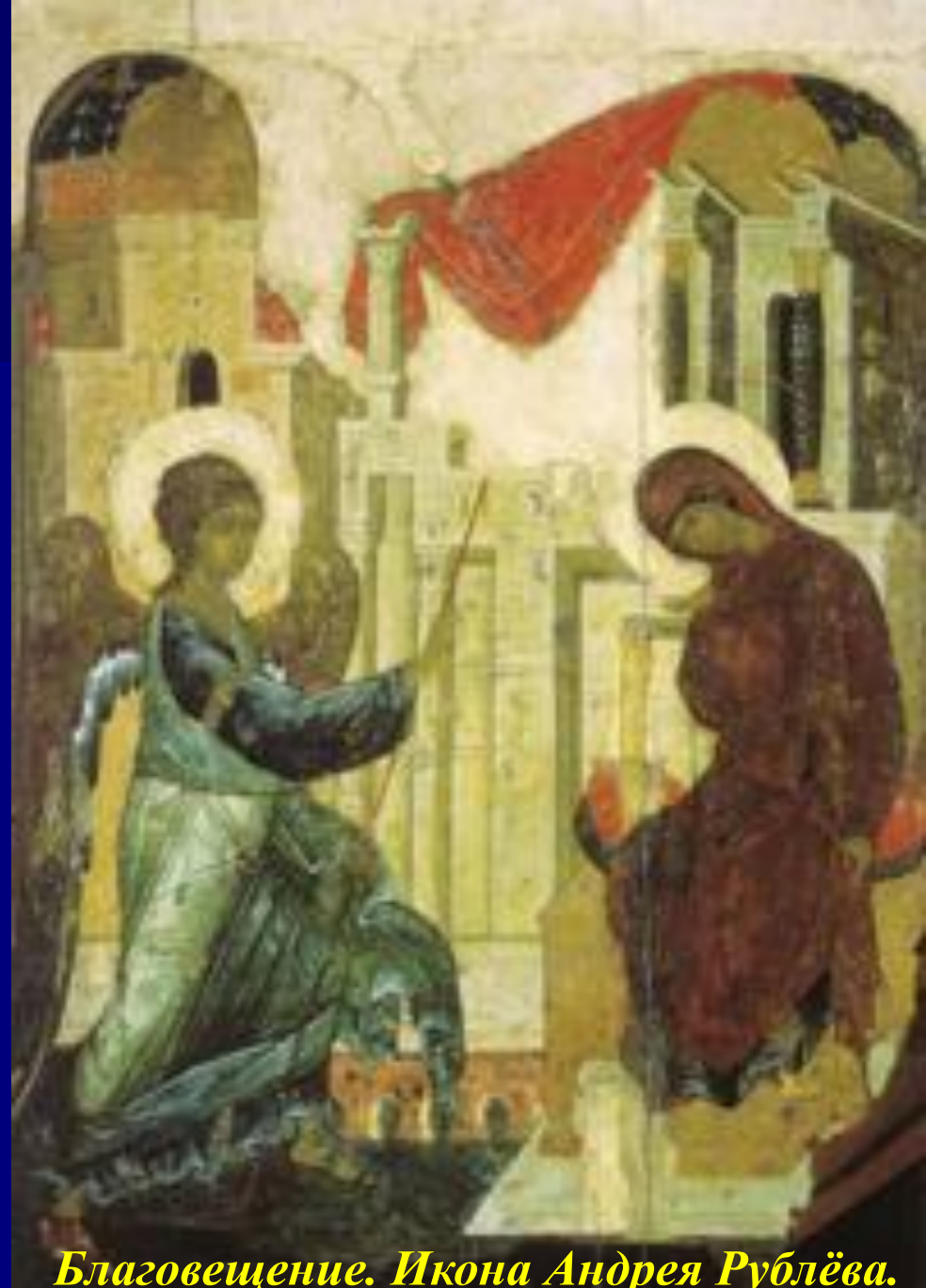
Благовещение. Икона Андрея Рублёва. 1427 – 1430. Андроников монастырь.

Посмотрим на икону праздника: ангел сходит к Деве, чтобы ей возвестить «Благую весть». Архангел Гавриил принес Деве Марии самую большую новость – Сын Божий становится Сыном человеческим. Исполняется пророчество Исаии, Богородица отвечает согласием на весть ангела: «Да будет мне по слову твоему». Без этого добровольного согласия Бог не мог бы стать человеком. Он не мог бы воплотиться, так как Бог не действует силой, не принуждает нас ни к чему. Человеку дана полная свобода ответить Богу согласием и любовью.