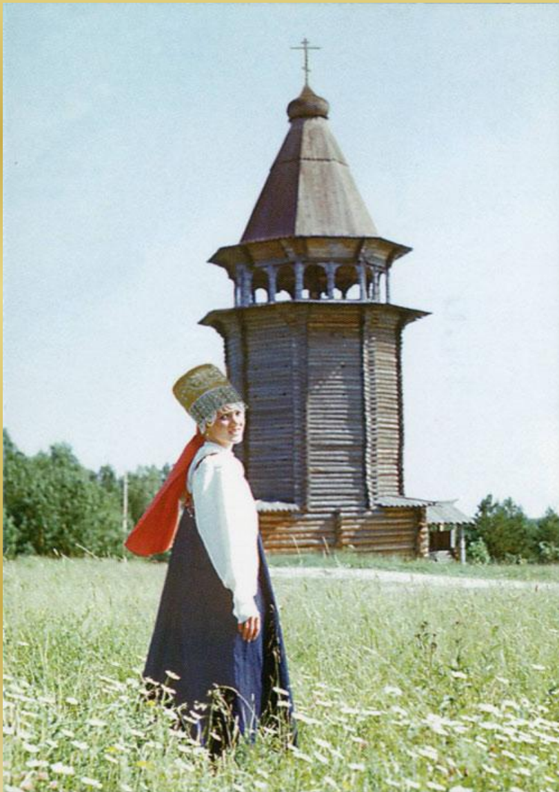
Девушка из города Мезень, начало XX века