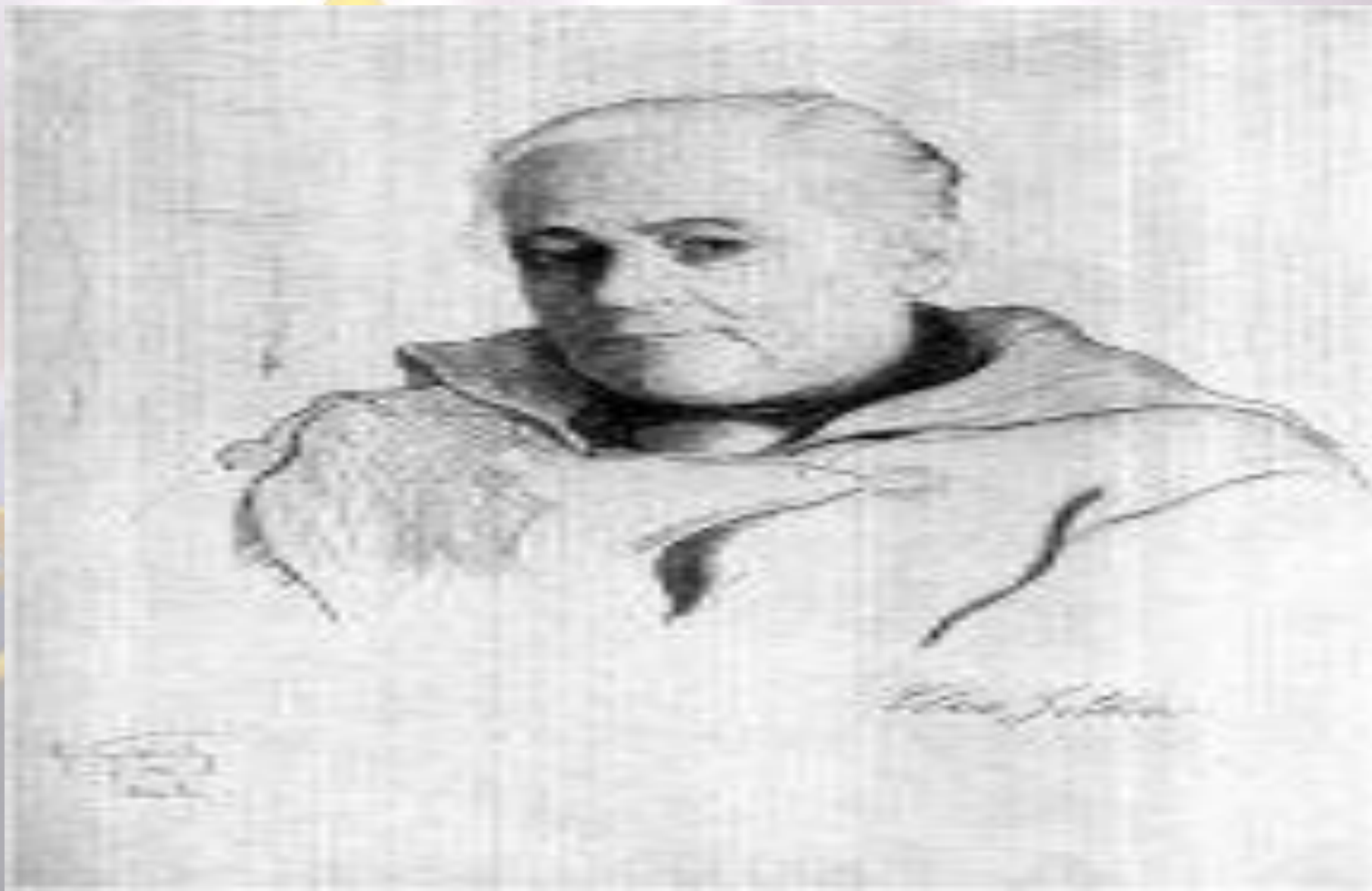
Клара Цеткин (Рисунок художника И. Бродского)