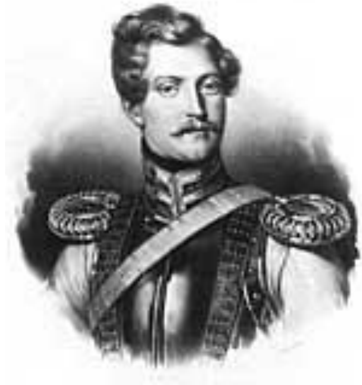
Ж. Дантес-Геккерн. 1830-е гг.

В начале 1834 г. в Петербурге появился француз барон Дантес.