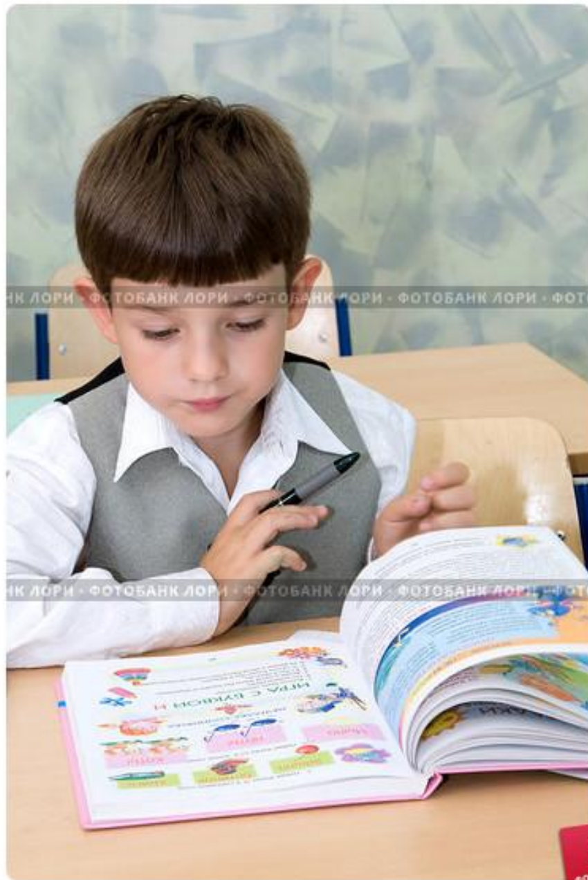
Урок в школе. Мальчик-первоклассник читает книгу