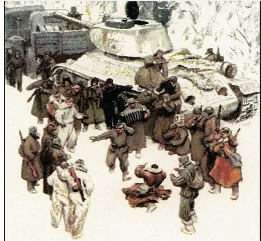
Иллюстрация к поэме А.Т. Твардовского «Василий Тёркин». Художник О.Г. Верейский. 1943 г.

• Повествование поэмы не связано с ходом войны 1941—1945 годов, но в нём присутствует хронологическая последовательность; упоминаются и угадываются конкретные сражения и операции Великой Отечественной войны, начиная с