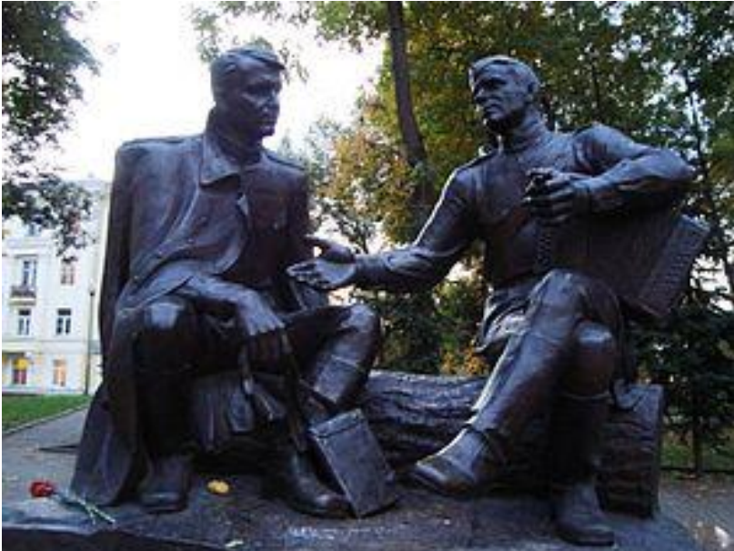
Памятник Твардовскому и Василию Тёркину в Смоленске

• Помимо прочего, «Василий Тёркин» выделяется среди других своим отсутствием идеологической линии и партии.