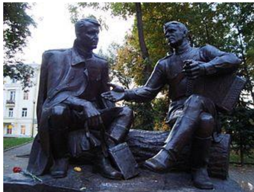
Памятник Твардовскому и Василию Тёркину в Смоленске