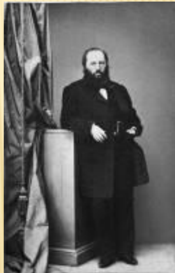
Отец - Афанасий Неофитович Шеншин

А. А.Фет родился 23 ноября [5 декабря] 1820 в имении Новоселки Мценского уезда Орловской Губернии.