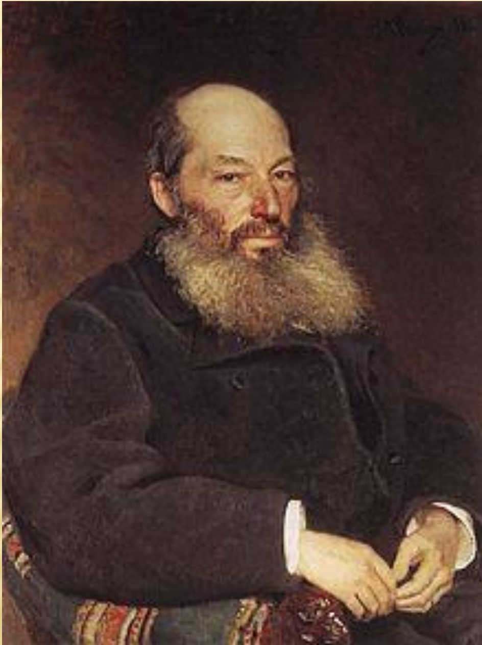
Афанасий Афанасьевич Фет (1820 – 1892)