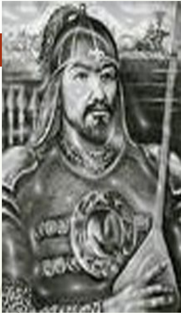
Шалкиіз жырау Тіленшіұлы (1465-1560)

Шалкиіз Тіленшіұлы (1465 — 1560 ж.) — жырау, орта ғасырлардағы қазақ поэзиясының көрнекті өкілі. Шалкиіз ер жүрек жауынгер әрі талантты жырау. Жігіттік шағы Ноғай ордасындағы Мұса бидің маңайында өткен. Кейіннен Үлкен Орданың әміршісі, Мансұрұлы Темір бидің және ноғайлы Жүсіп бидің төңірегінде, өмірінің соңғы кезін қазақ ханы Хақназар маңында өткізді. Оның шығарм-нан ортағасырлық қарапайым көшпелілердің өмірі туралы нанымды, моральдық, этикалық түсініктер көрініс тапқан. Шалкиіз шығармаларында ерлік рухқа, асқақ романтикаға толы жырлар да жеткілікті. Ол ертедегі қазақ поэзиясының өлең өрнегін байытқан ақын.