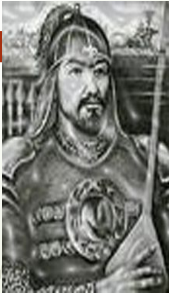
Шалкиіз жырау Тіленшіұлы (1465-1560)

Шалкиіз Тіленшіұлы (1465 — 1560 ж.) — жырау, орта ғасырлардағы қазақ поэзиясының көрнекті өкілі. Шалкиіз ер жүрек жауынгер әрі талантты жырау. Жігіттік шағы Ноғай ордасындағы Мұса бидің маңайында өткен. Кейіннен Үлкен Орданың әміршісі, Мансұрұлы Темір бидің және ноғайлы Жүсіп бидің төңірегінде, өмірінің соңғы кезін қазақ ханы Хақназар маңында өткізді. Оның шығарм-нан ортағасырлық қарапайым көшпелілердің өмірі туралы нанымды, моральдық, этикалық түсініктер көрініс тапқан. Шалкиіз шығармаларында ерлік рухқа, асқақ романтикаға толы жырлар да жеткілікті. Ол ертедегі қазақ поэзиясының өлең өрнегін байытқан ақын.