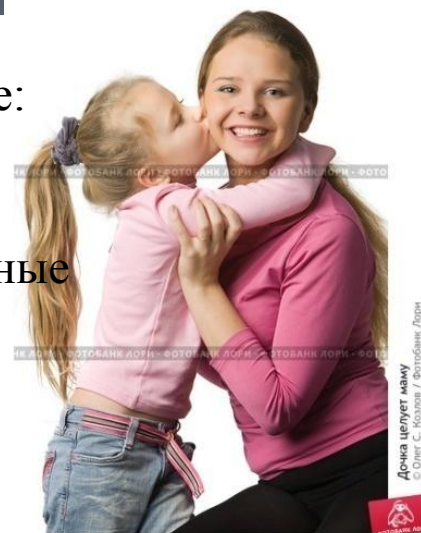
Дочка целует маму