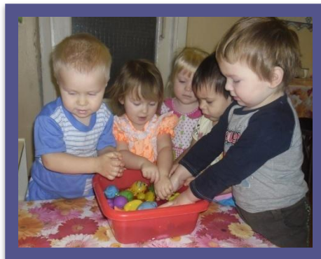
Уголок развития речи