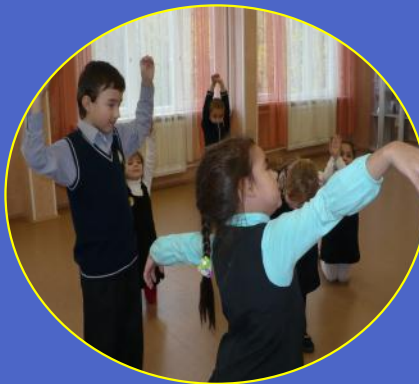
Подвижные игры на переменах