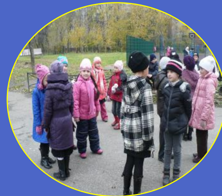
Ежедневны е прогулки