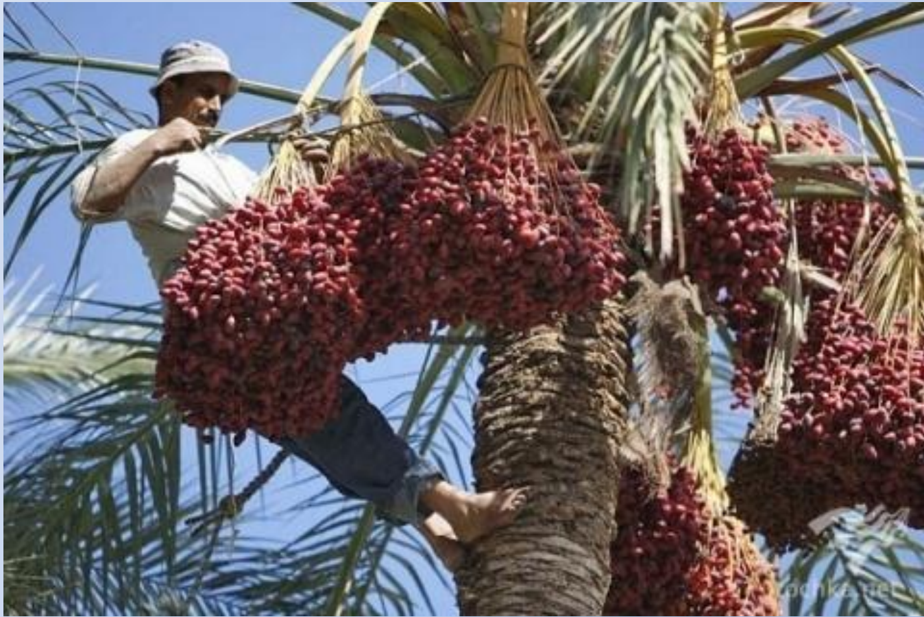
Сбор фиников в Ливане