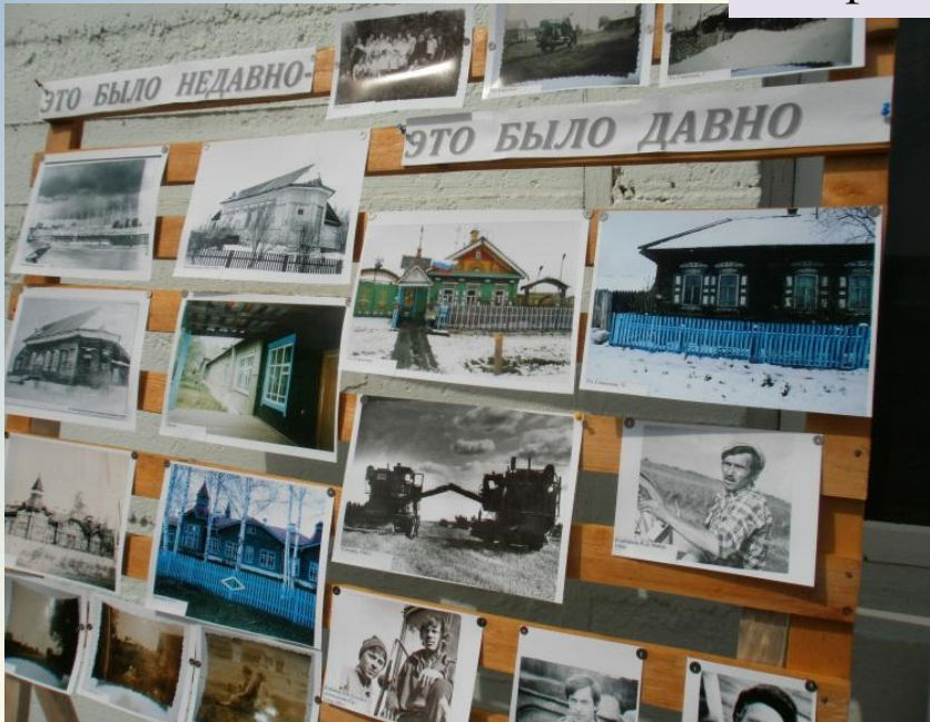
180-летие села Балахтон