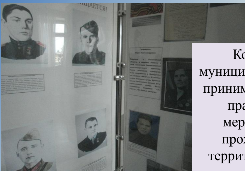
К Дню Победы

Козульский муниципальный архив принимает участие в праздничных мероприятиях, проходящих на территории района, используя фотодокументы