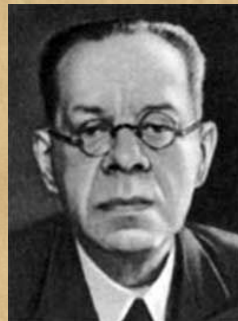
редактор М. Лозинский