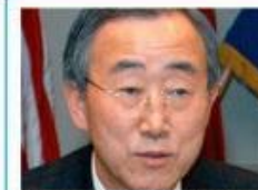
Генеральный секретарь Пан Ги Мун