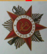
Орден Отечественной войны II степени