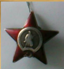
Орден Красной звезды