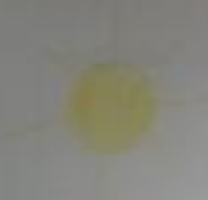
ветер и туман

Типы усложненного развития растений невооруженным: