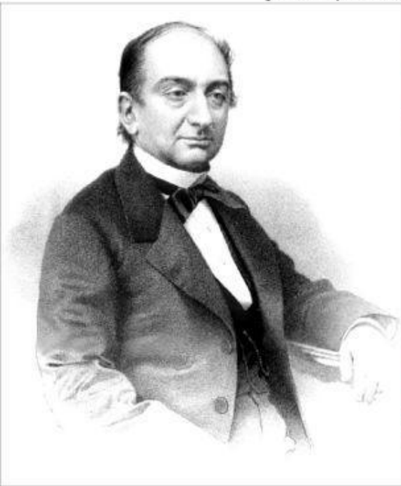
Иван Делянов (1818-1897)

В 1884 г. был издан новый университетский устав . Ректоры, деканы, профессора отныне не избирались, а назначались министром просвещения. Университетский суд ликвидирован, полиция получила право доступа в университеты. По существу, университетская автономия уничтожена.