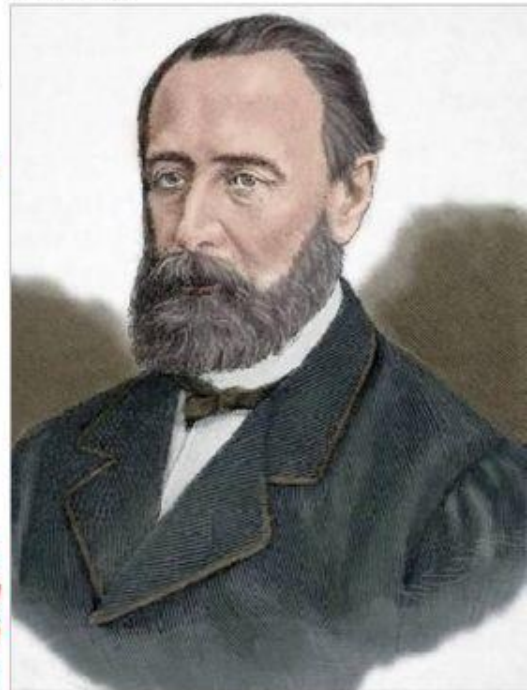
Михаил Катков (1818-1887)

«Новый университетский устав важен не для одного учебного дела, он важен еще и потому, что полагает собой начало новому движению в нашем законодательстве: как устав 1863 г. был началом системы упразднения государственной власти, так устав 1884 г. представляет собой возобновление правительства, возвращение властей к их обязанностям» .