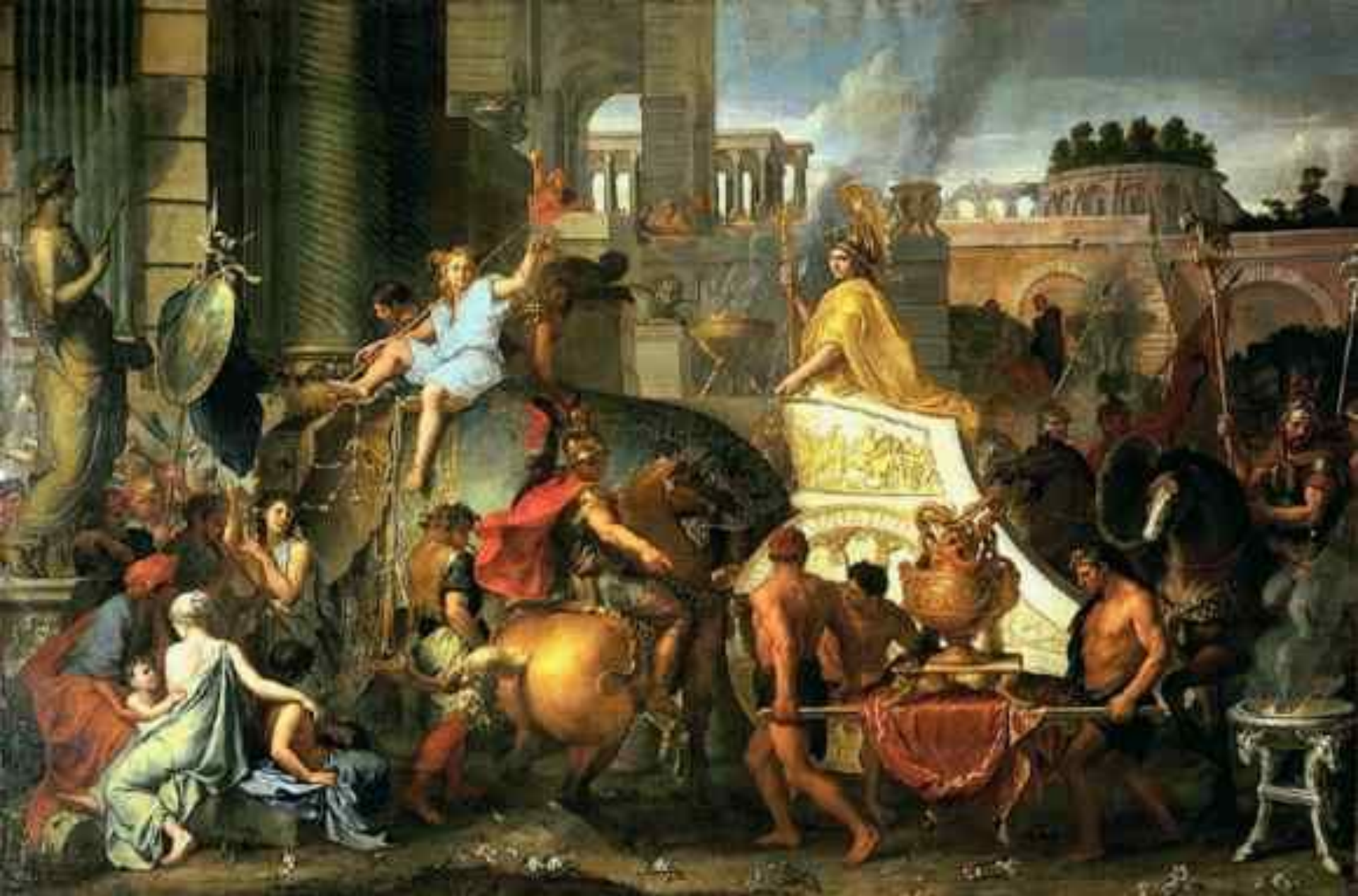
Лебрен Александр Македонский в Вавилоне.