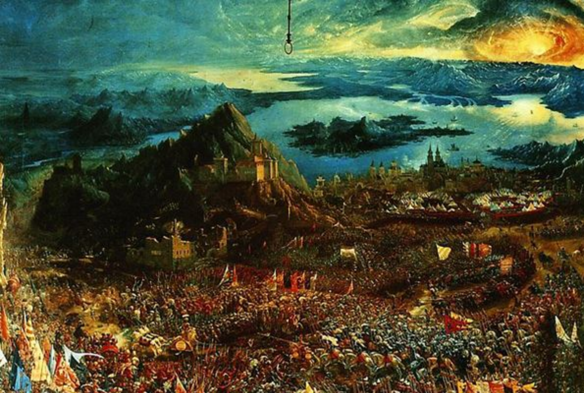
"Битва Александра Македонского с Дарием" работы Альбрехта