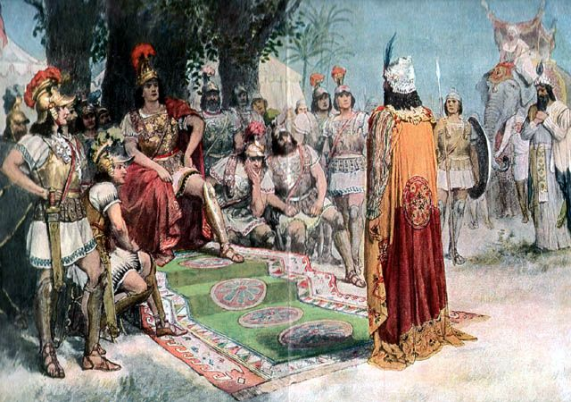
Александр Македонский встречается с царем Пора.