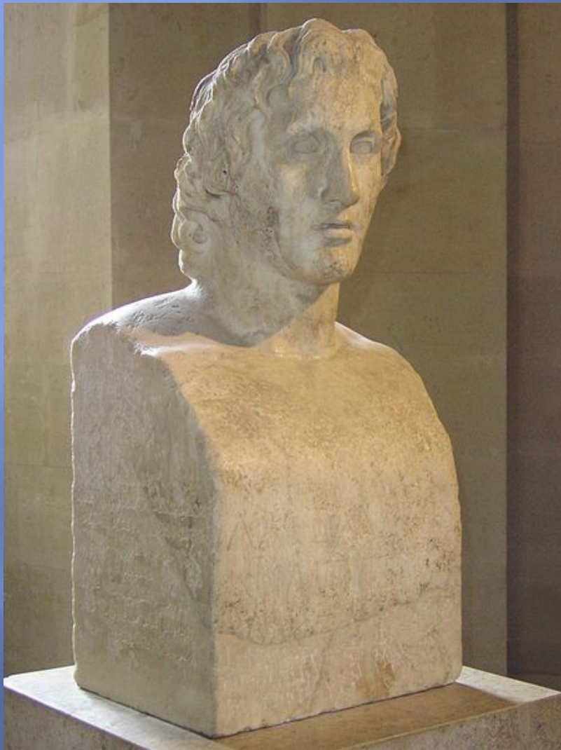
Александр Великий , римська копія герми