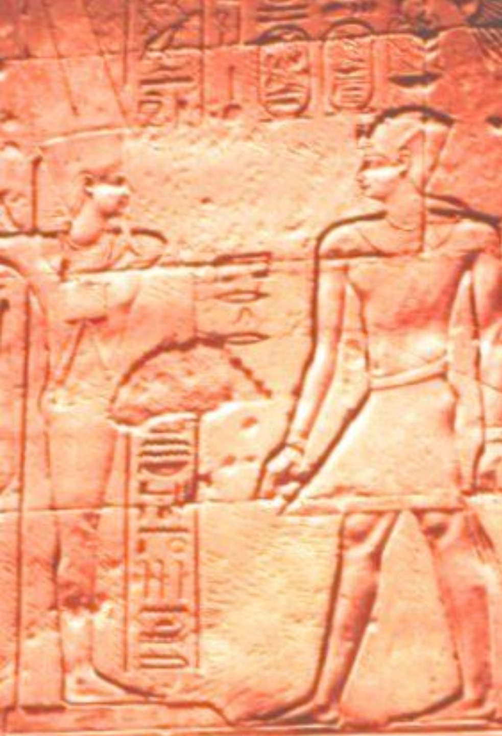
Александр Македонский как египетский фараон.