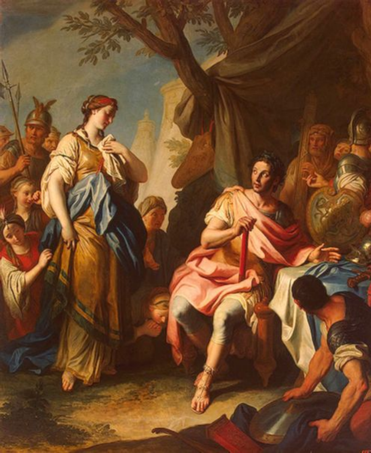
Александр Македонский и Роксана, дата создания картины - 1756 Художник: Ротари, Пьетро