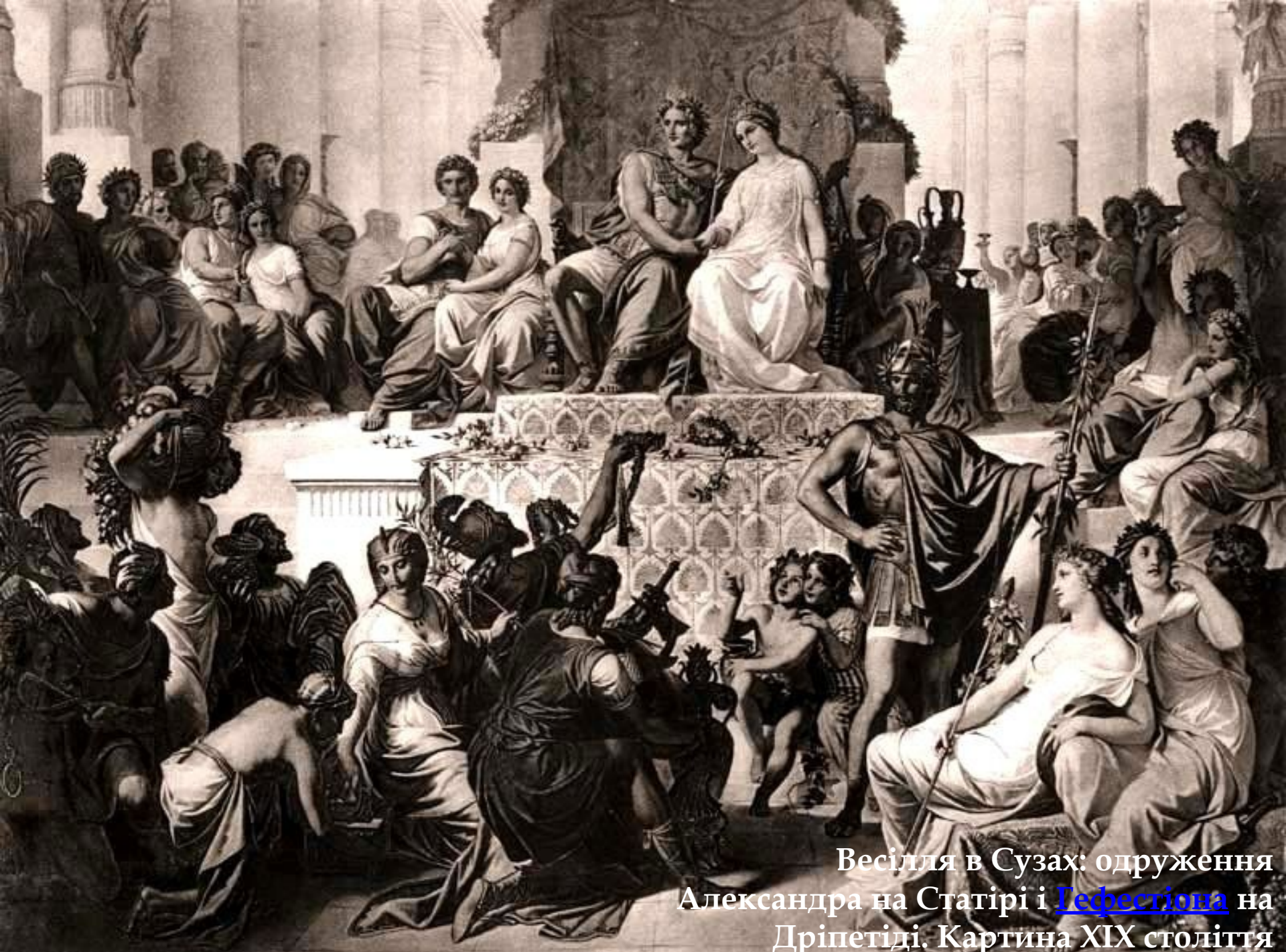
Весілля в Сузах: одруження Александра на Статірі і Гепестіона на Дріпетіді. Картина ХІХ століття