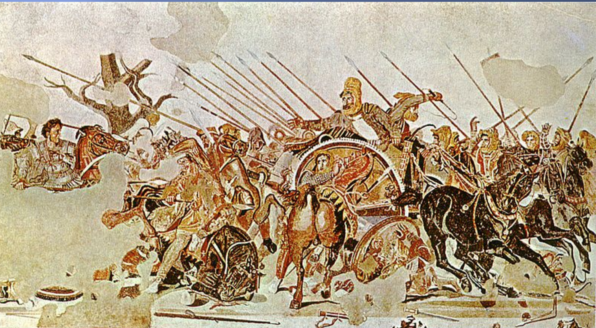
Битва при Іссі на Мозаїці Александра