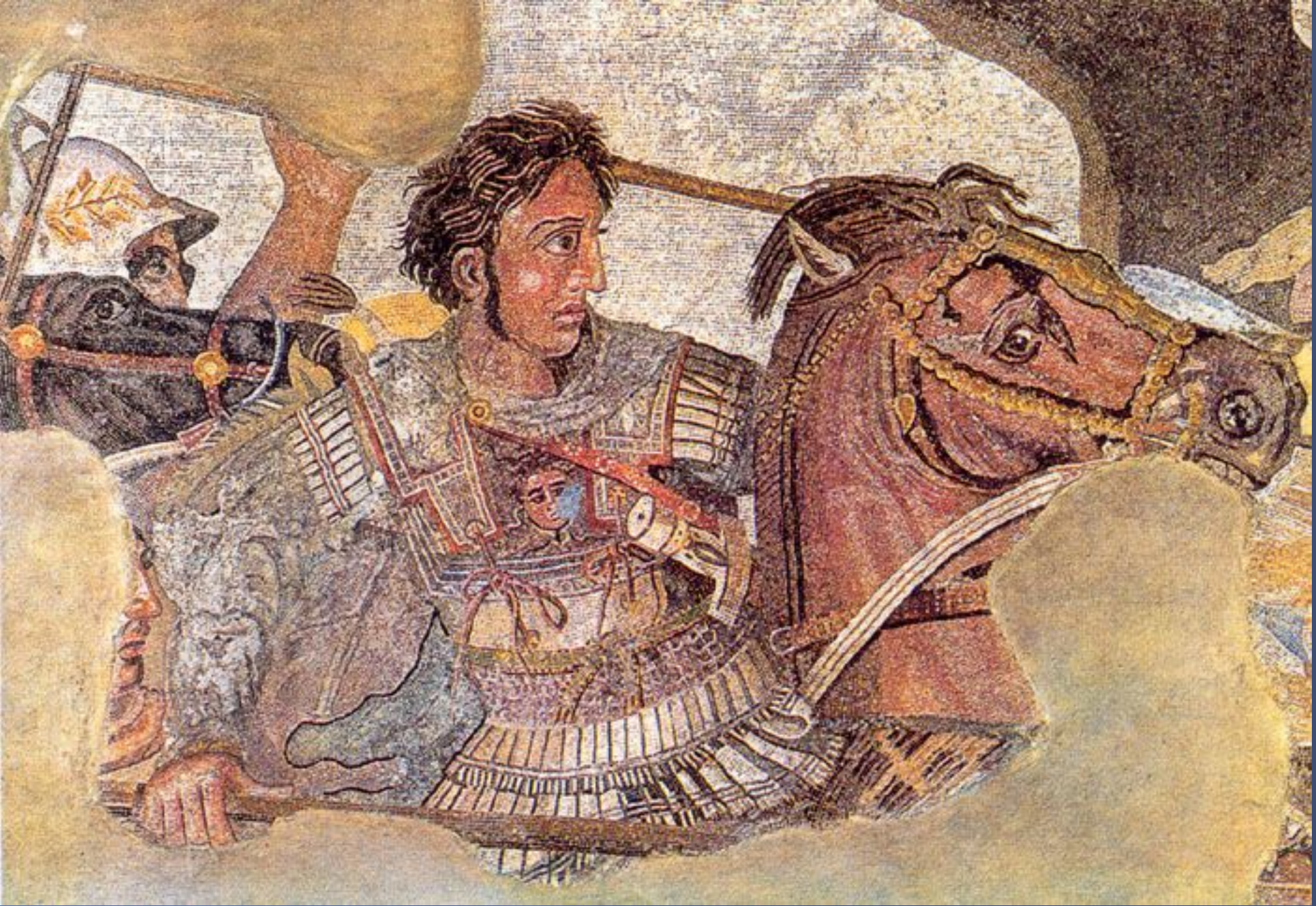
Александр III Македонський