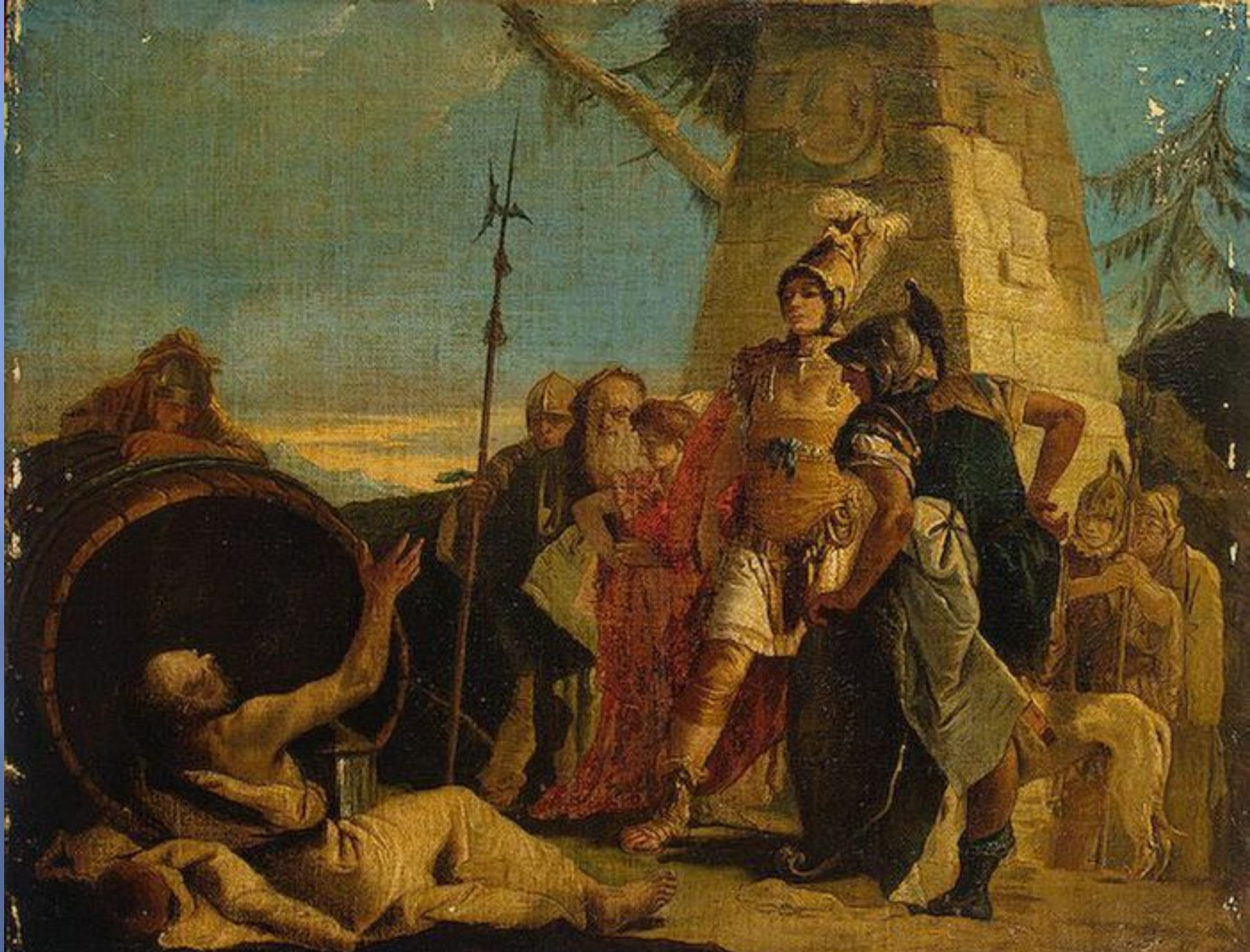
Диоген и Александр