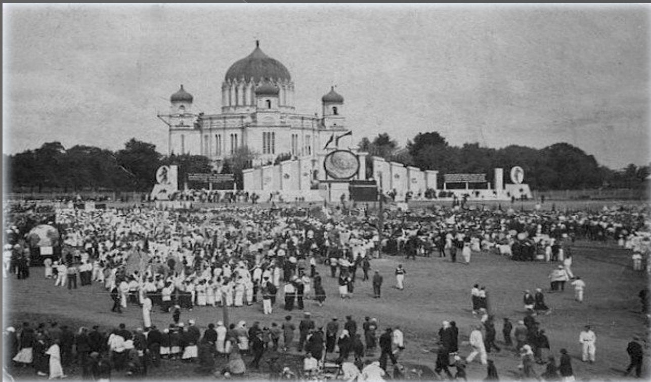
Митинг на площади Александро-Невского собора. Фото серед. 1930-х гг. •

22 марта 1932 года президиум Вятгорсовета признал необходимым Александровский собор закрыть и перестроить его под Дворец физкультуры. Нижегородский крайисполком ответил отказом. Но местные варвары не оставляли своих планов. 19 февраля 1935 г. Горсовет направил в комитет по охране памятников при Президиуме ВЦИК докладную записку, в которой предлагалось исключить из списка памятников, охраняемых государством, шесть городских храмов и снести их, в их числе - Александровский собор. Комитет отклонил просьбу. Следующее ходатайство о сносе собора последовало в 1936 г., уже от Кировского облисполкома - и опять отказ.