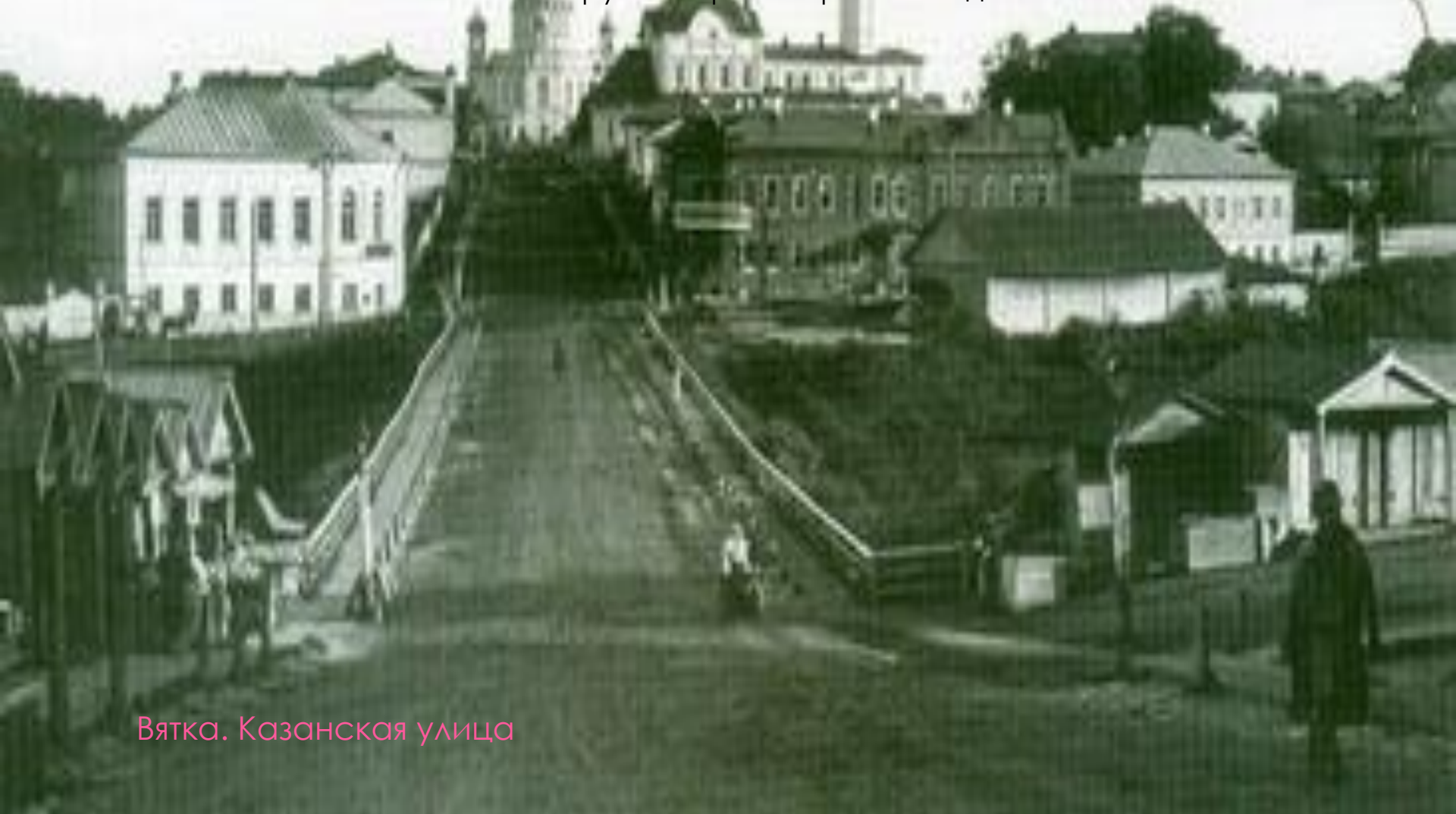
Вятка. Казанская улица

8 октября 1864 года, день в день ровно через сорок лет после посещения Вятки императором Александром Первым главный престол Александровского собора был освящен при огромном стечении народа. Место для храма было выбрано очень удачно: он стоял на высоком месте, посреди огромной площади, занимавшей четыре городских квартала, и был виден отовсюду не только из города, но и из далеких его окрестностей. Круглый в плане собор имел 50 метров в высоту и столько же в диаметре. Стиль постройки - эклектика, смесь элементов архитектуры византийской, готической и древнерусской. В последующие годы вокруг собора был разбит сад.