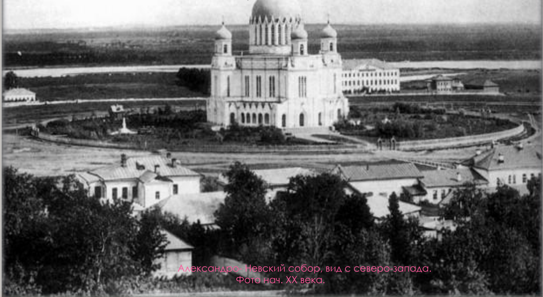
Александров-Невский собор, вид с северо-запада. Фото нач. XX века.

30 августа 1839 года преосвященным Неофитом, епископом Вятским, совершена была торжественная закладка храма. "При этом было обычное торжество и ликованье, - писал в статье о соборе П.В. Алабин, - лишь поразительно своею печалью было одно лицо - сам Витберг. Мы слышали от очевидца события, что Витберг во все время закладки храма рыдал, как дитя! Кто объяснит нам глубокое и горькое значение этих слез? Что совершалось с Витбергом в эти мгновения? Пред очами души его не проносилась ли другая закладка, при иной обстановке, в присутствии царей и сонма царственных особ, пред лицом всей Москвы живой и каменной, пред лицом лучших представителей войск, едва возвратившихся с пути мировых побед..."