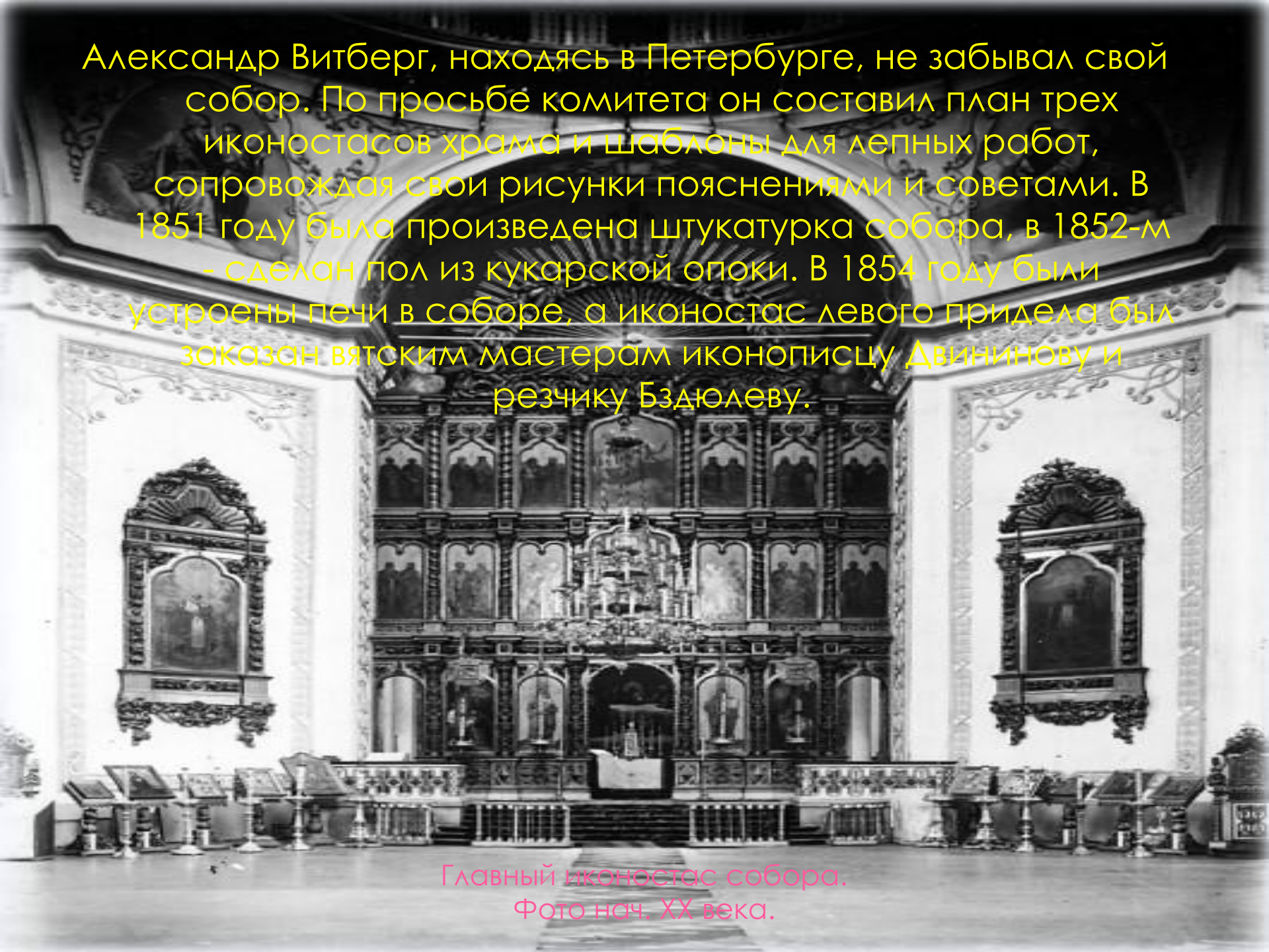
Главный иконостас собора. Фото нач. XX века.