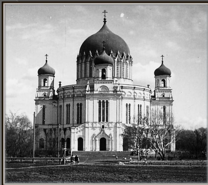
Александро-Невский собор в Вятке. Вид с запада. Фото 1920-х гг.