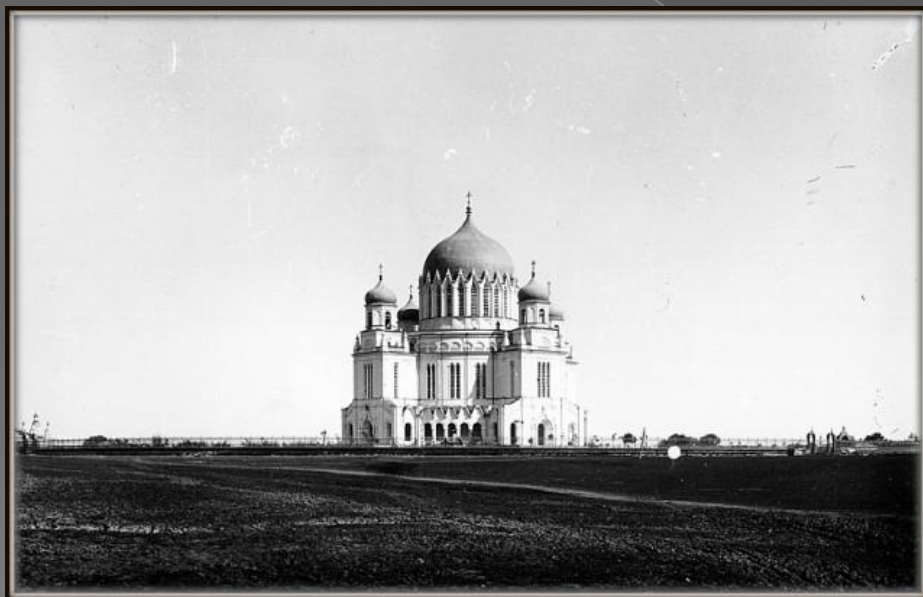
Александро-Невский собор в Вятке. Вид с юго-западной стороны. Фото нач. XX века.