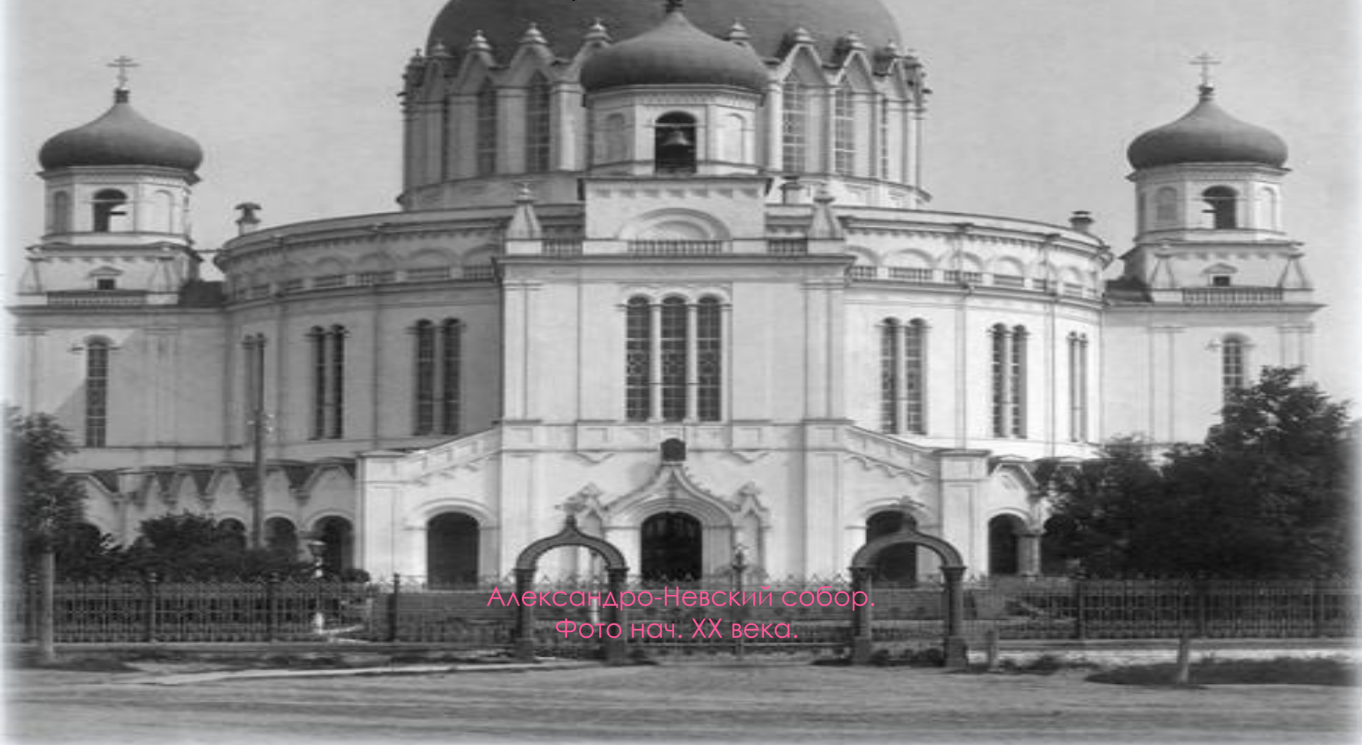
Александрo-Невский собор. Фото нач. XX века.

Строительство продолжалось до 1841 года, когда истощилась казна комитета. Был воздвигнут один фундамент грандиозной постройки. Снова начался сбор средств. В летние месяцы 1847 и 1848 годов строительство шло столь быстрыми темпами, что 28 августа была закончена каменная кладка всего храма, а купола покрыты железом. В 1850 году были подняты колокола.