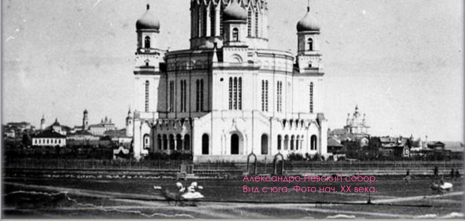
Александр-Невский собор. Вид с юга. Фото нач. XX века.

Александр Лаврентьевич Витберг, сосланный в Вятку после неудачи с постройкой грандиозного храма Христа Спасителя в Москве, уже был хорошо известен к этому времени в вятском обществе своими планами для построек городского сада и публичной библиотеки. Идея о сооружении нового храма в память императора Александра была принята Витбергом с большим воодушевлением, архитектор по праву считал покойного государя своим другом и покровителем. 28 октября 1839 года Витберг сообщил комитету, что чертежи плана, фасада и разреза храма готовы. Комитет рассмотрел эти чертежи и 8 марта благодарил архитектора в самых лестных выражениях за понесенные труды.