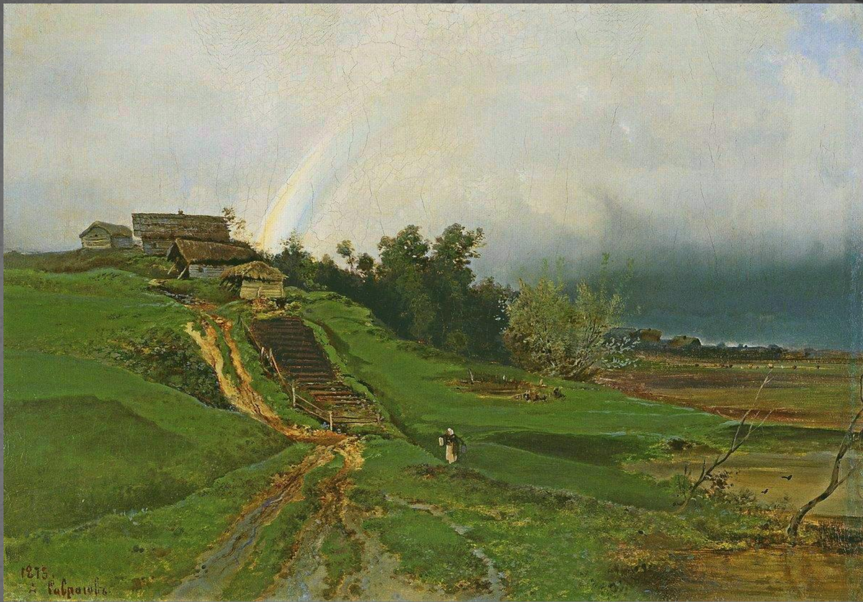
● "Радуга", 1875