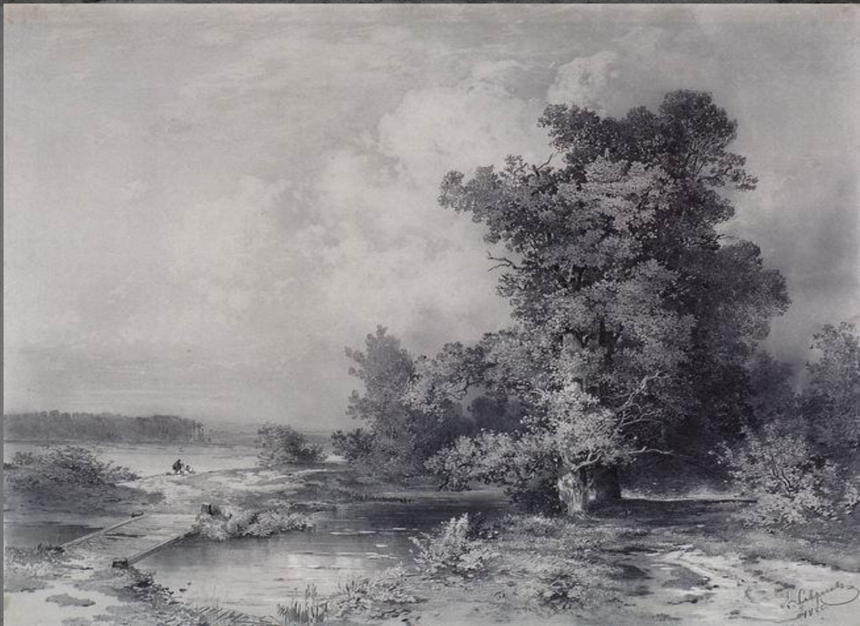
● “Вид в селе Кунцево”, 1855