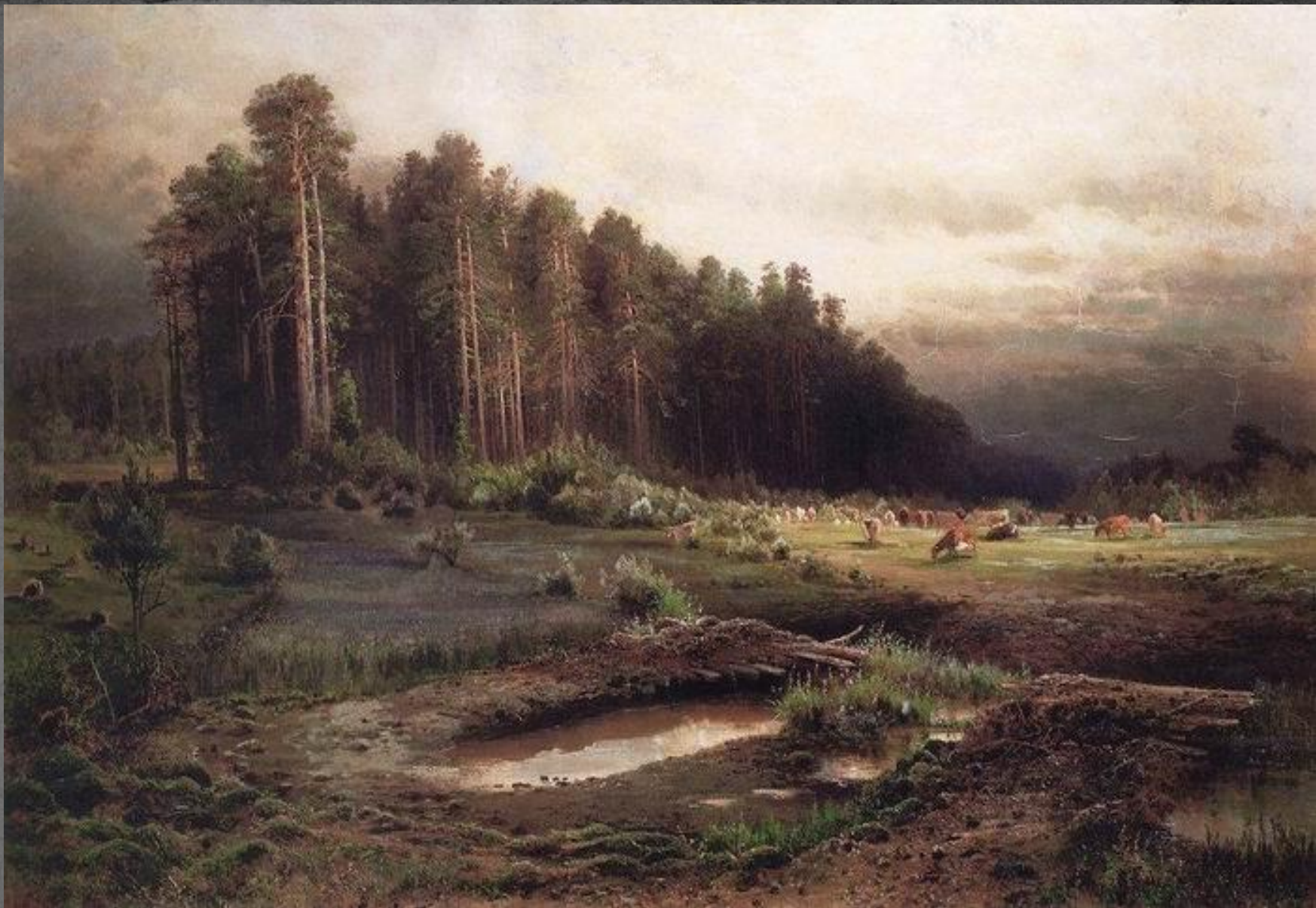
● "Лосиный остров" (1869)