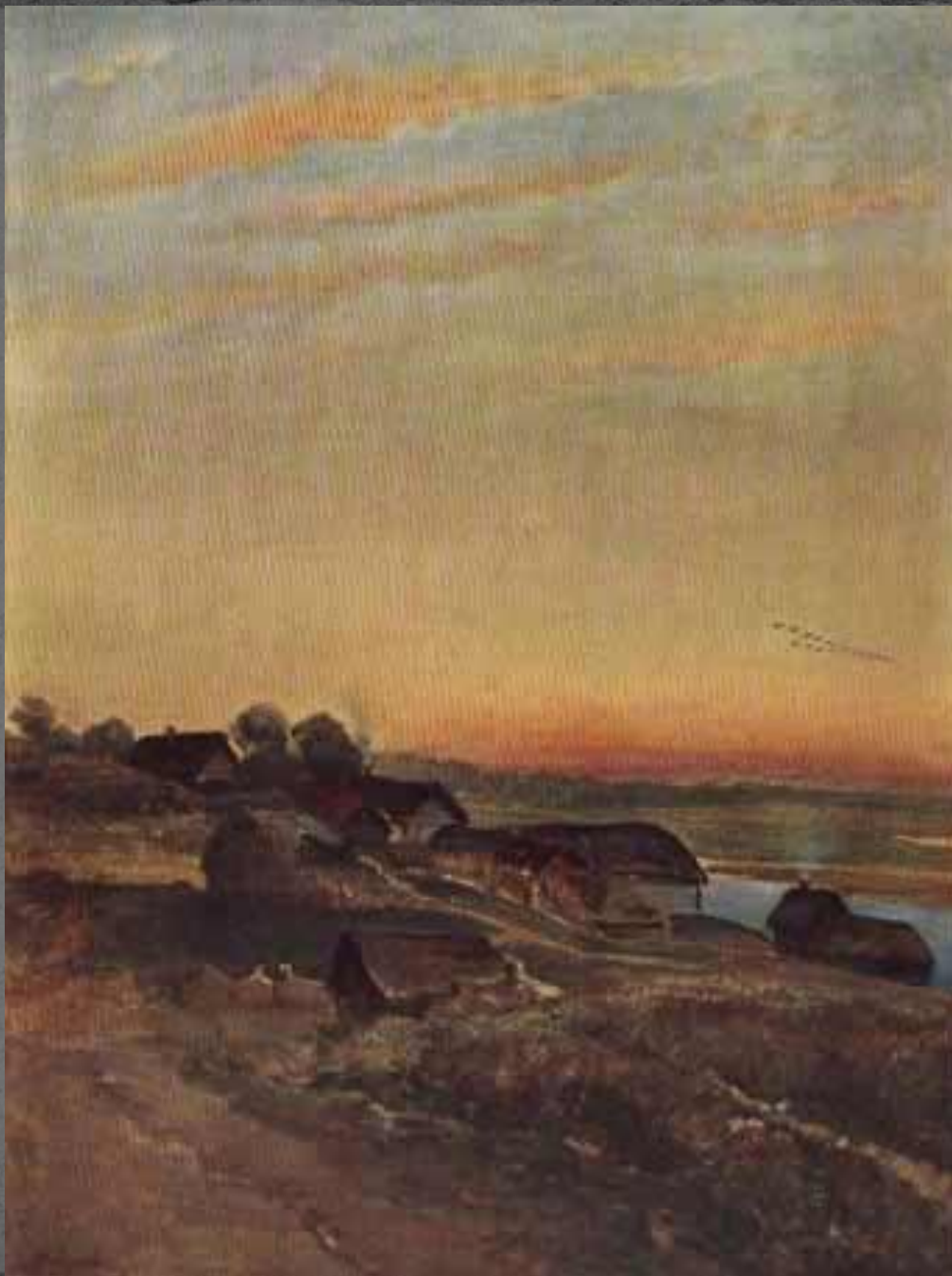
● "Северная деревня"