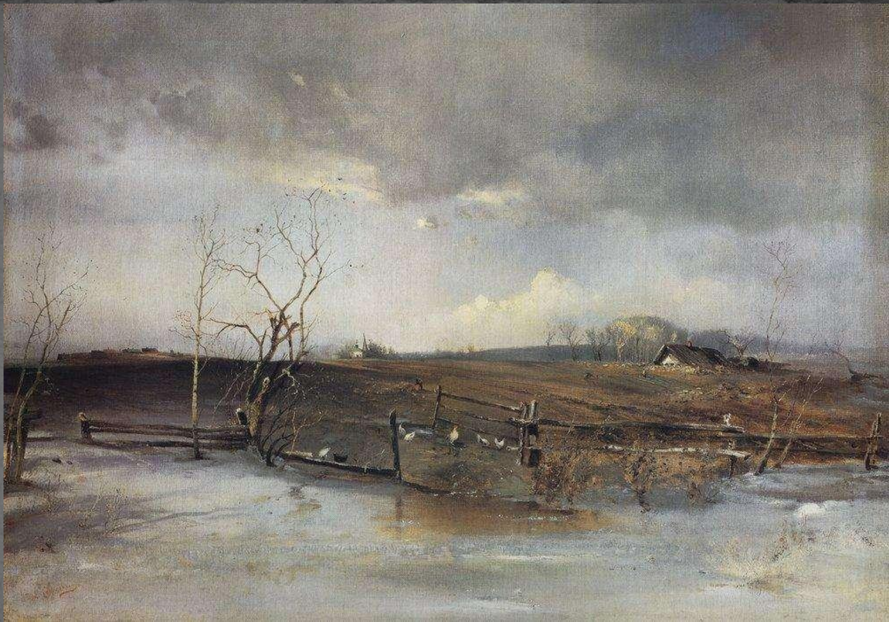
● "Весна. Огороды", 1883