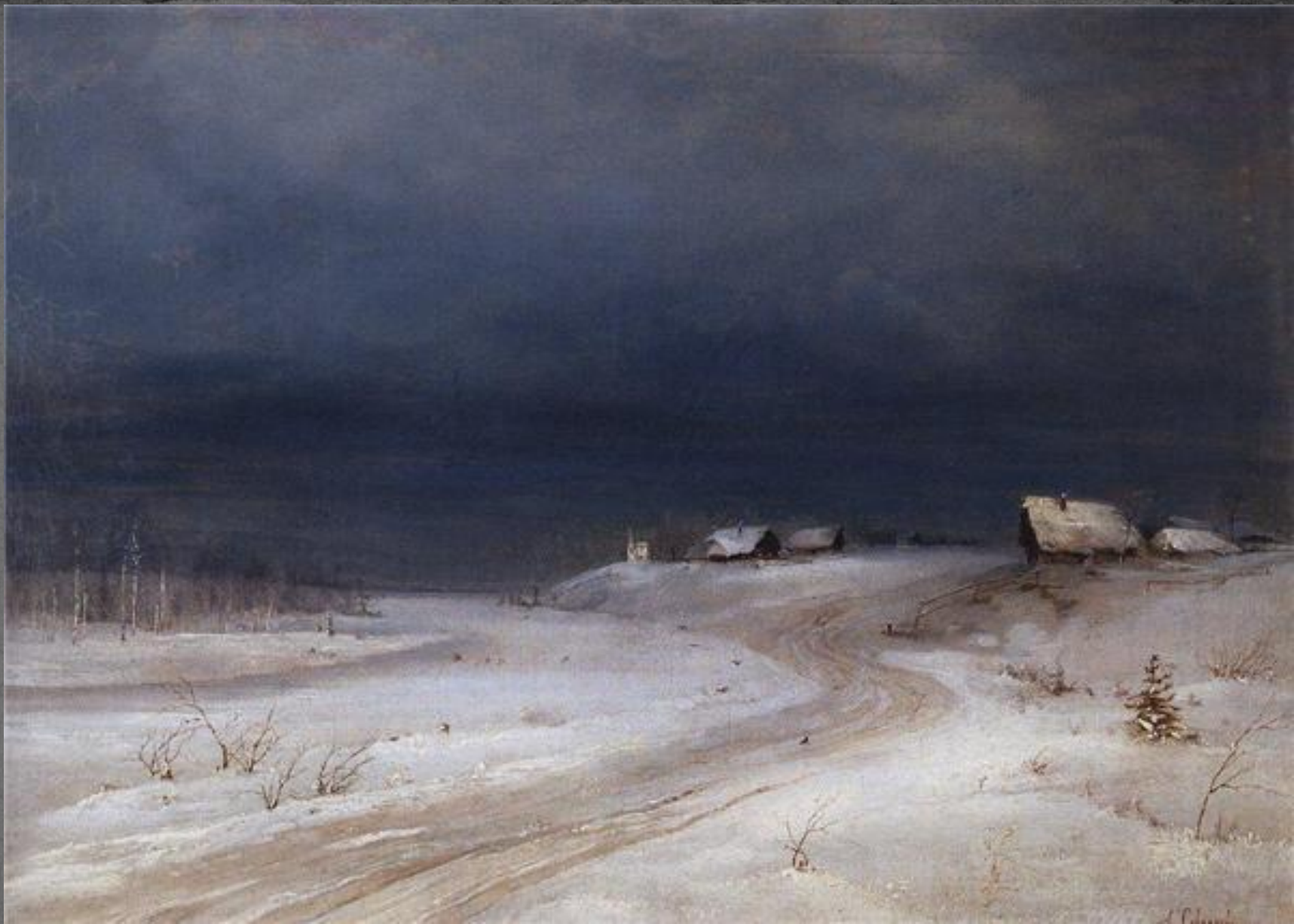
● "Зимний пейзаж"