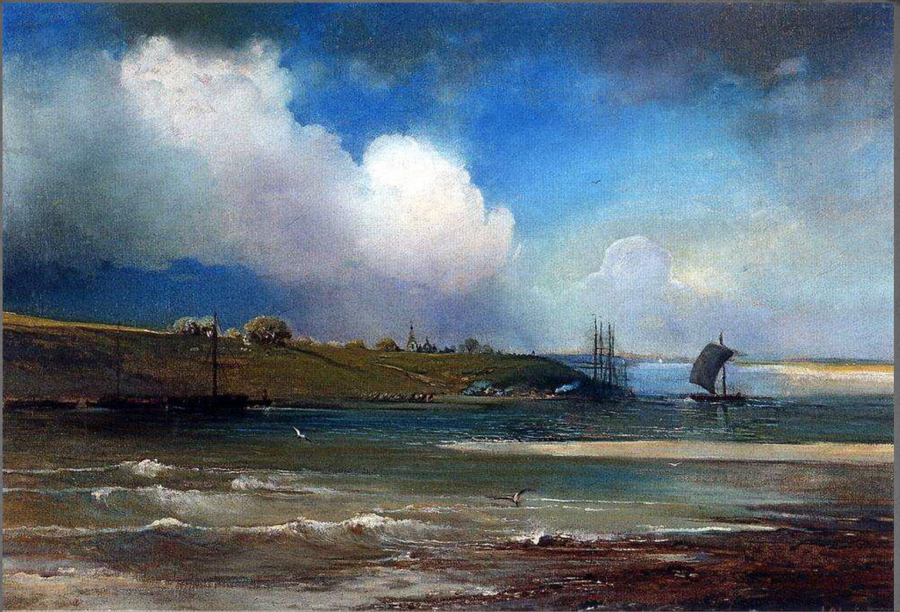
● "Волга под Юрьевцем", 1871