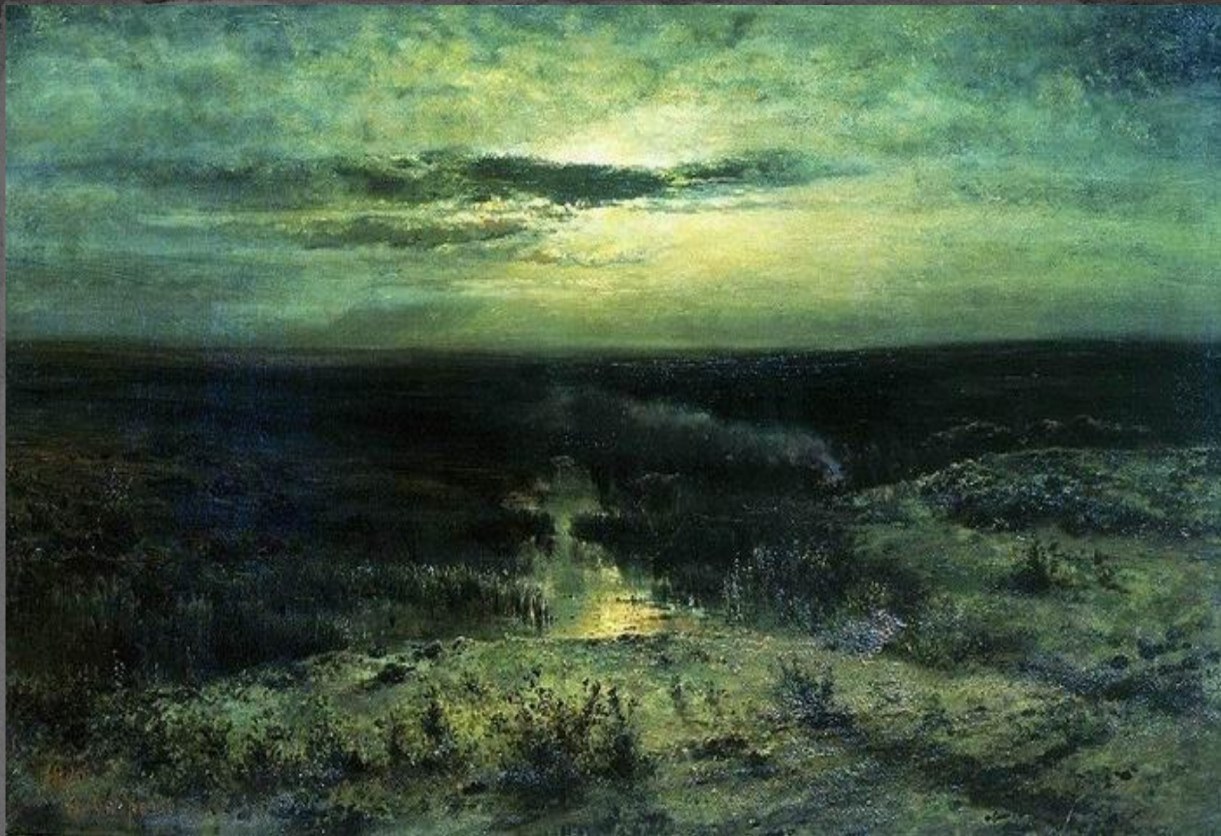
● "Лунная ночь. Болото", 1870