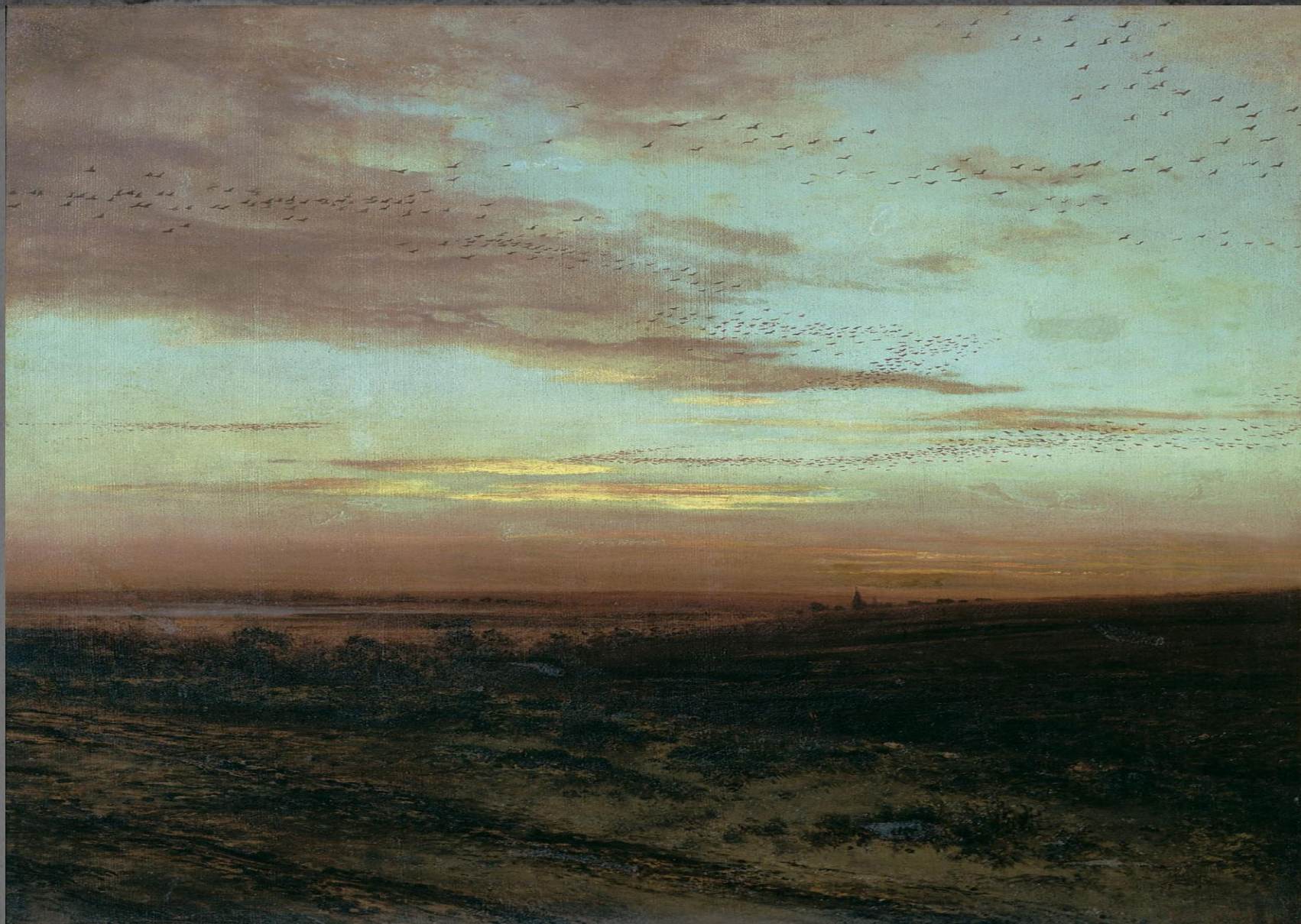
● "Вечер. Перелет птиц", 1874