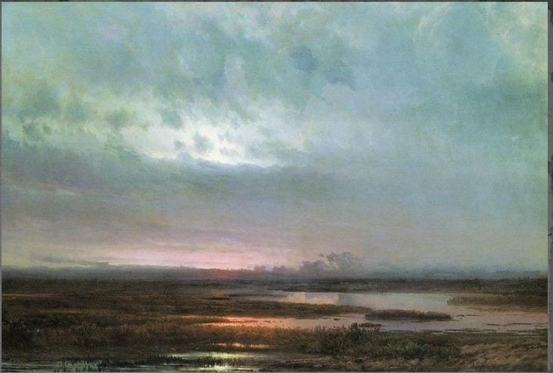
● "Закат над болотом", 1871