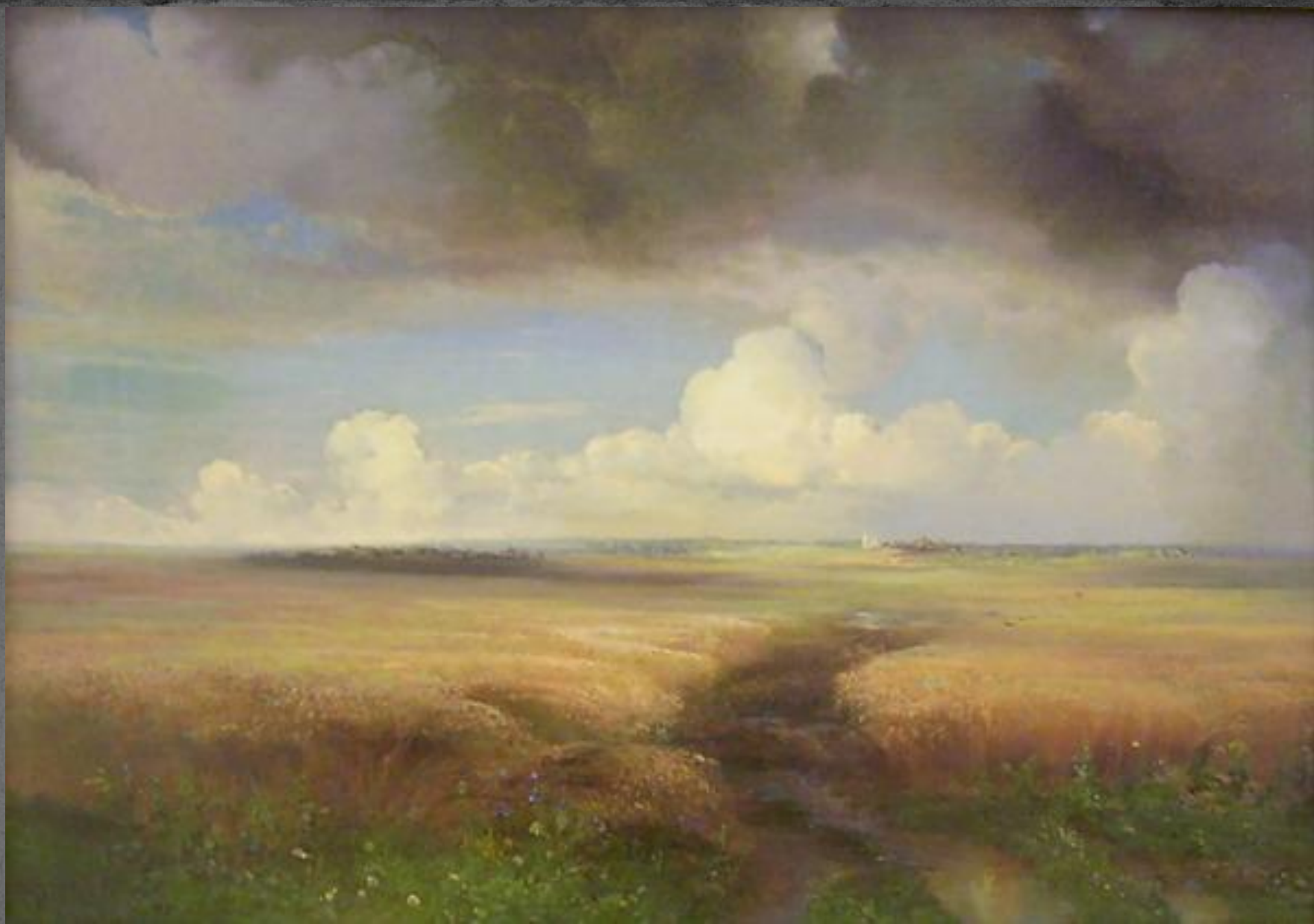
● "Рождь", 1881