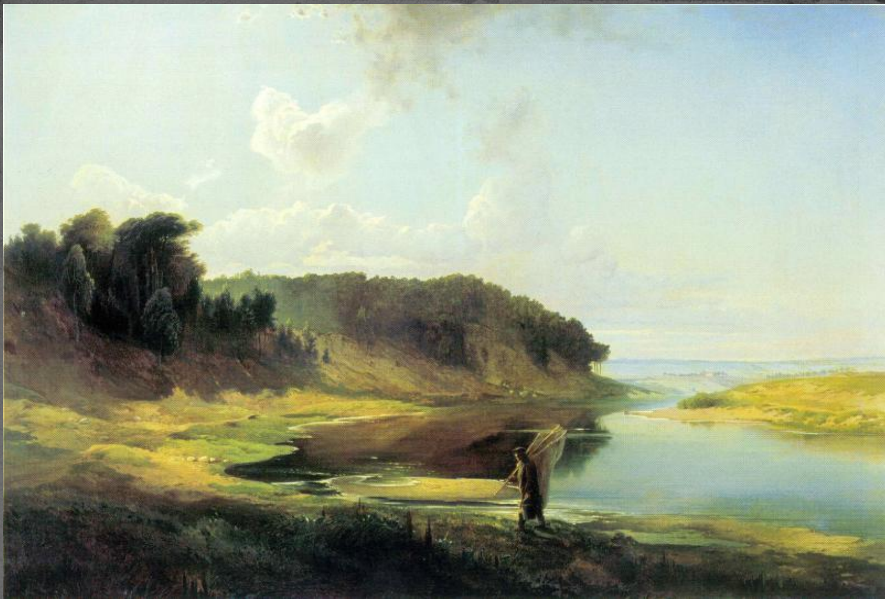
● “Пейзаж с рекой и рыбаком”, 1859