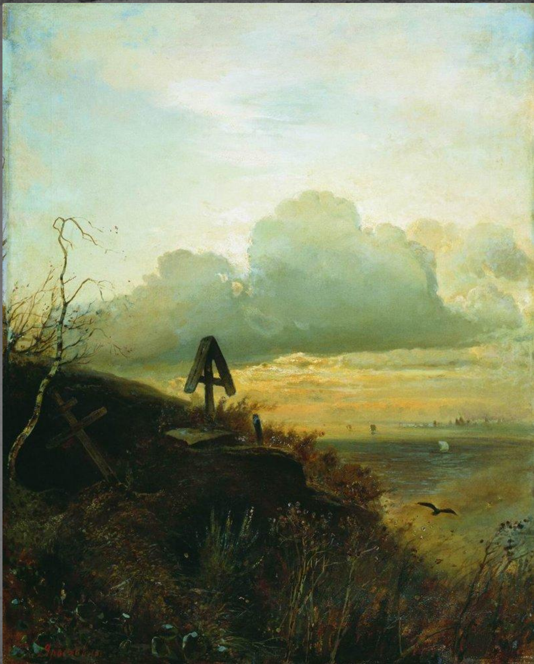
● "Могилы над Волгой", 1874