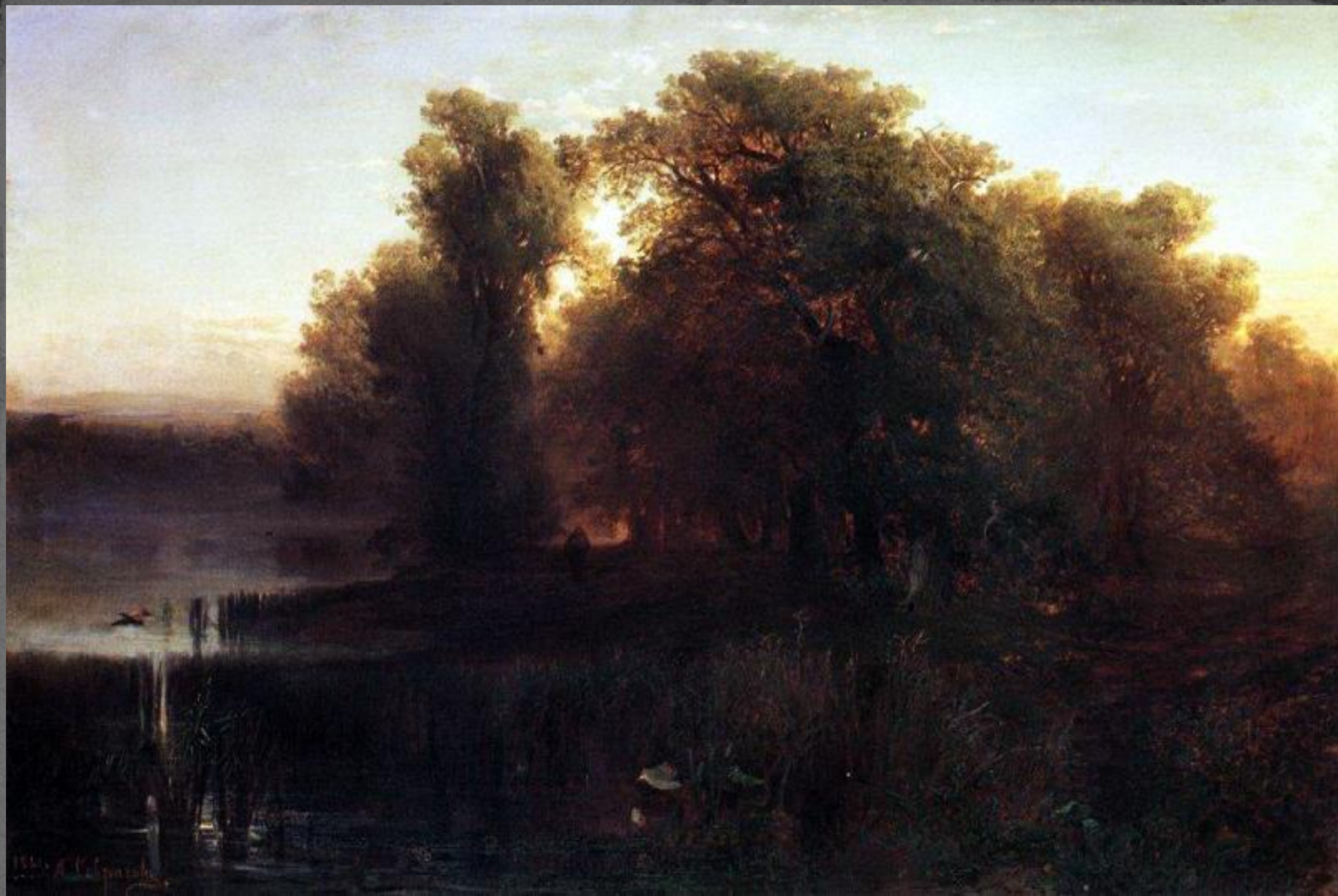
● "Вечерний пейзаж", 1861