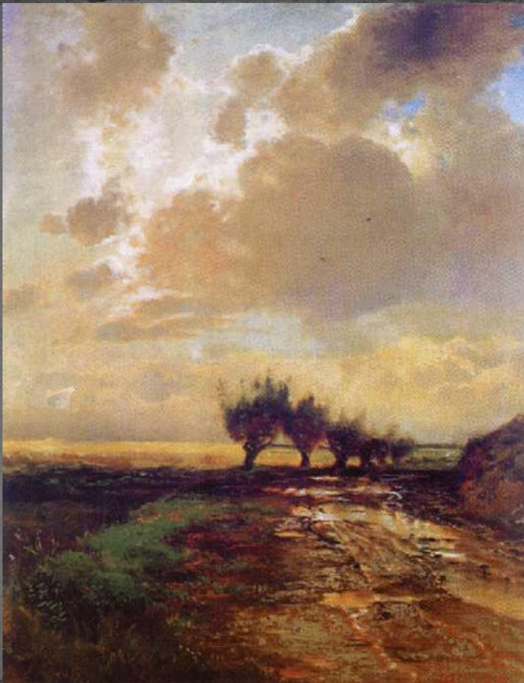
● "Проселок", 1873