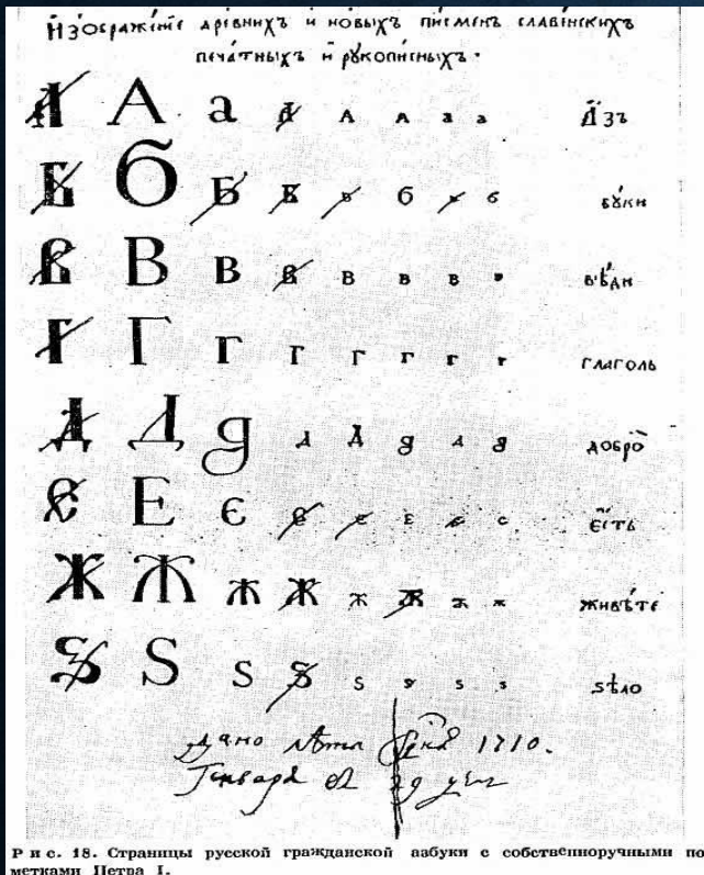
Р и с. 18. Страницы русской гражданской азбуки с собственноручными пометками Петра I.