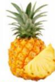
Продукты, наиболее часто вызывающие