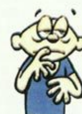
состояние патологического страха