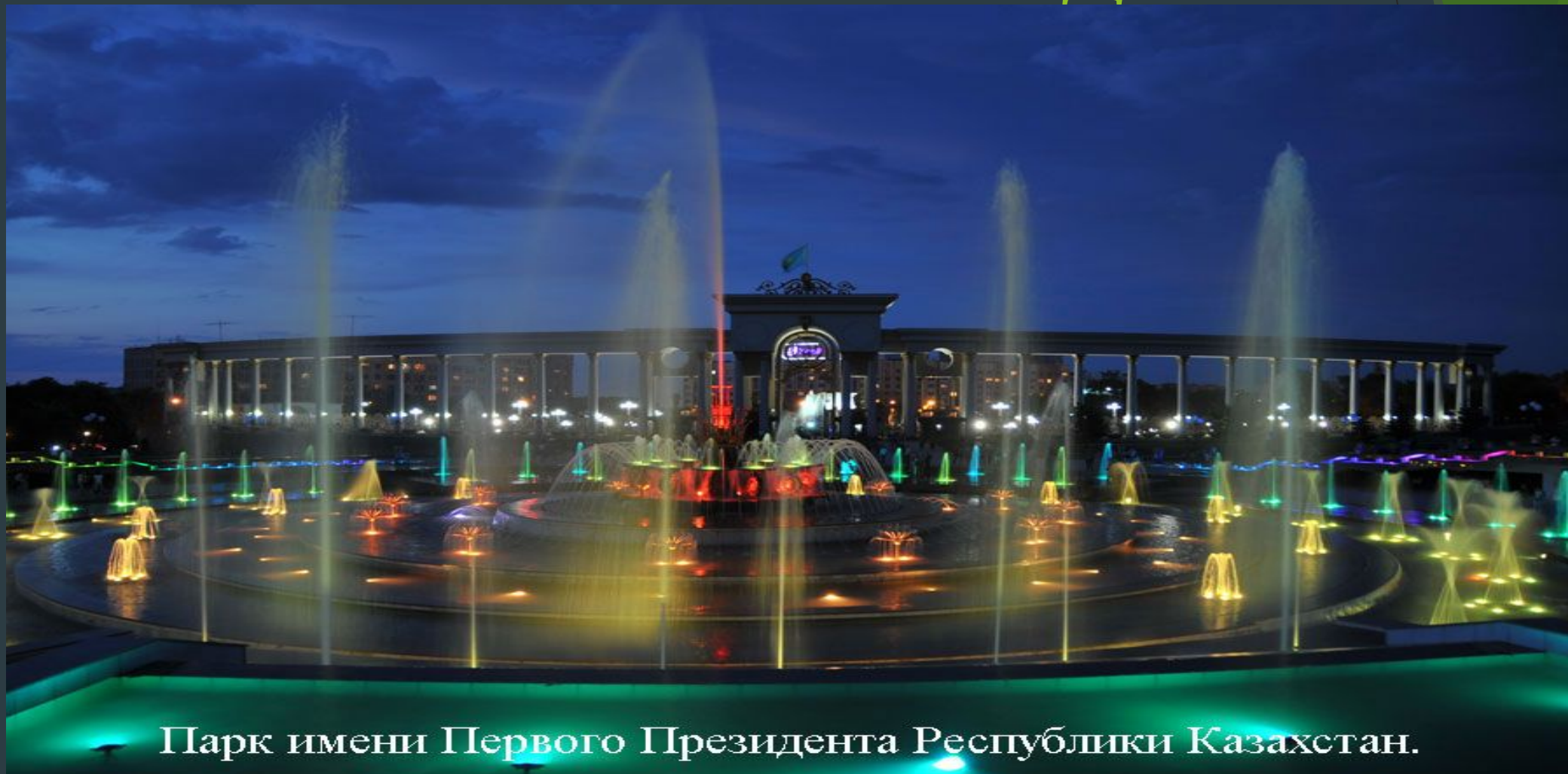
Парк имени Первого Президента Республики Казахстан.