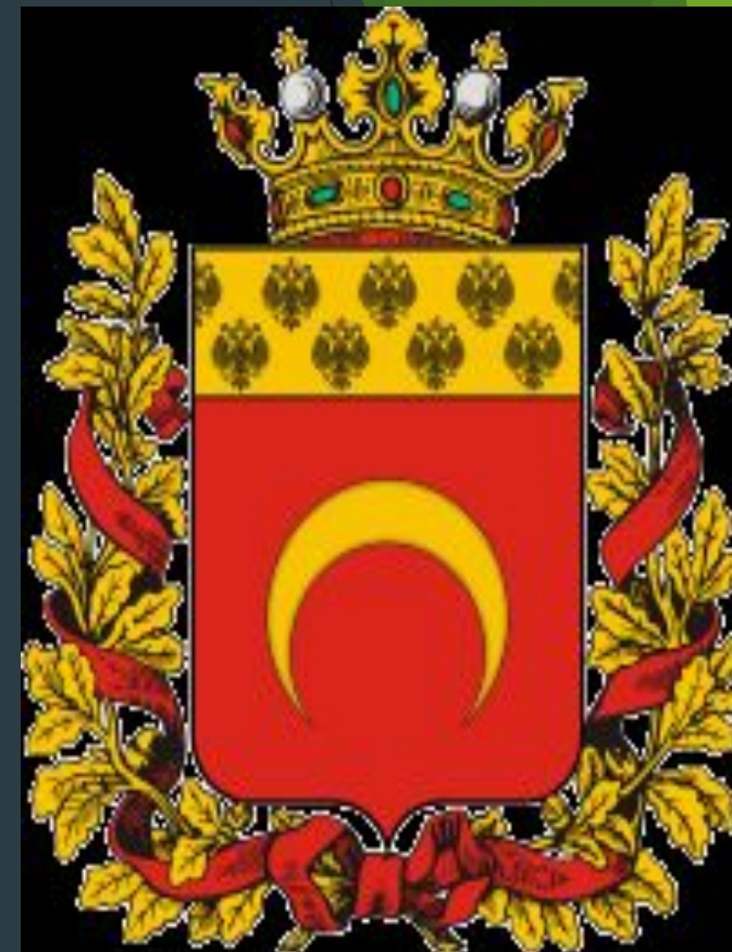
Алматы қаласының алғашқы елтаңбасы