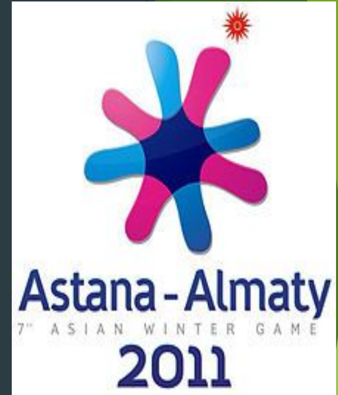
VII Қысқы Азия Ойындарының елтаңбасы