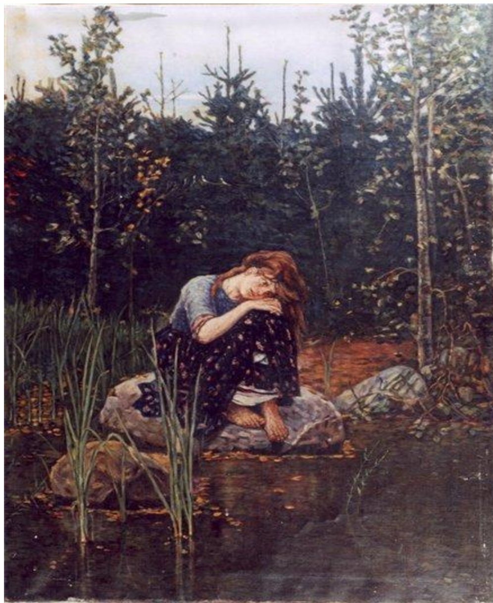
картина В. М. Васнецова