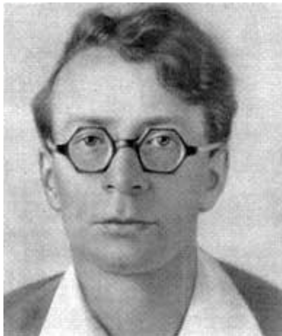
Дмитрий Борисович Кедрин