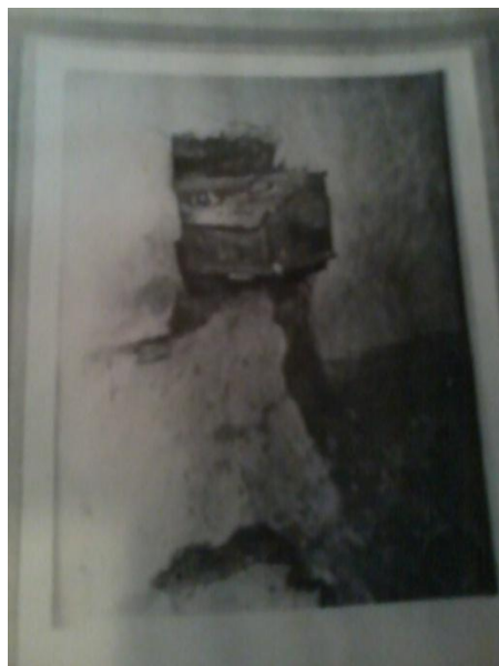
Радиоприемники группы подпольников