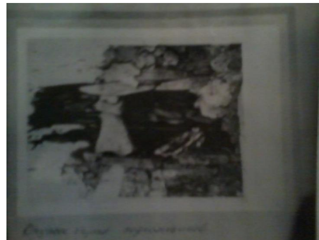
Оружие группы подпольников