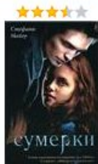
Стефани Майер Сумерки 434 руб