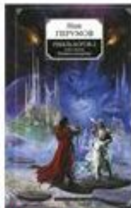
Гибель Богов-2. Книга 1. Память пламени