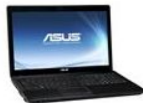
Asus X54HR... Электроника 12111 руб