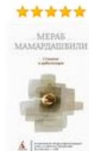
Мераб Мамардашвили Сознание и цивилизация 241 руб