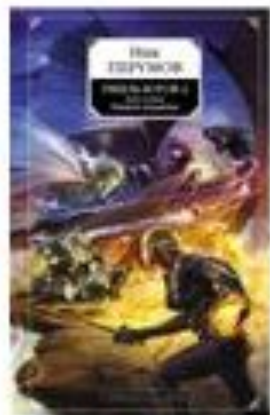
Гибель Богов-2. Книга 2. Удерживая небо