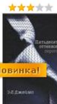
Э. Л. Джеймс Пятьдесят оттенков серого 288 руб