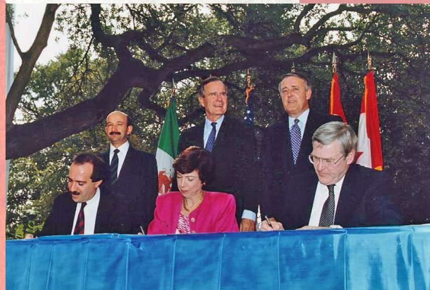
Представители США, Канады и Мексики подписывают Североамериканское соглашение о свободной торговле (НАФТА) в 1992 году