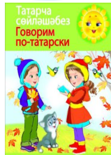
«Без инде хәзер зурлар, мәктәпкә илтә юллар» (Мы теперь уже большие, в школу ведут дороги)