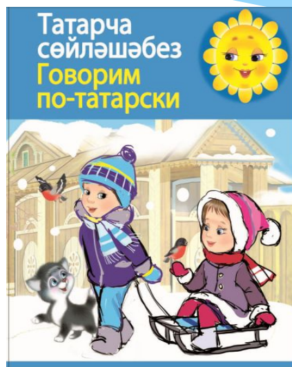
«Уйный-уйный үсәбез» (Растем, играя)