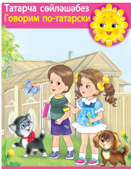
«Минем өем» (Мой дом)