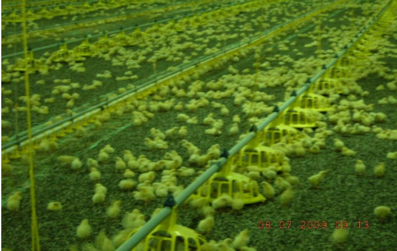
Рис.1 Вирощування курчат-бройлерів на глибокій підстилці