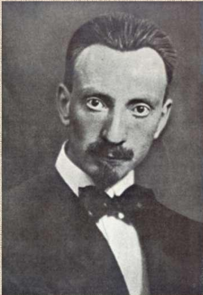
–Луїджі Руссоло Італійський художник, композитор і поет футуристичного напрямку