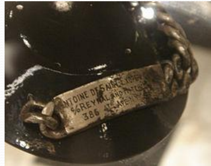
Браслет Сент-Экзюпери, найденный рыбаком близ Марселя.