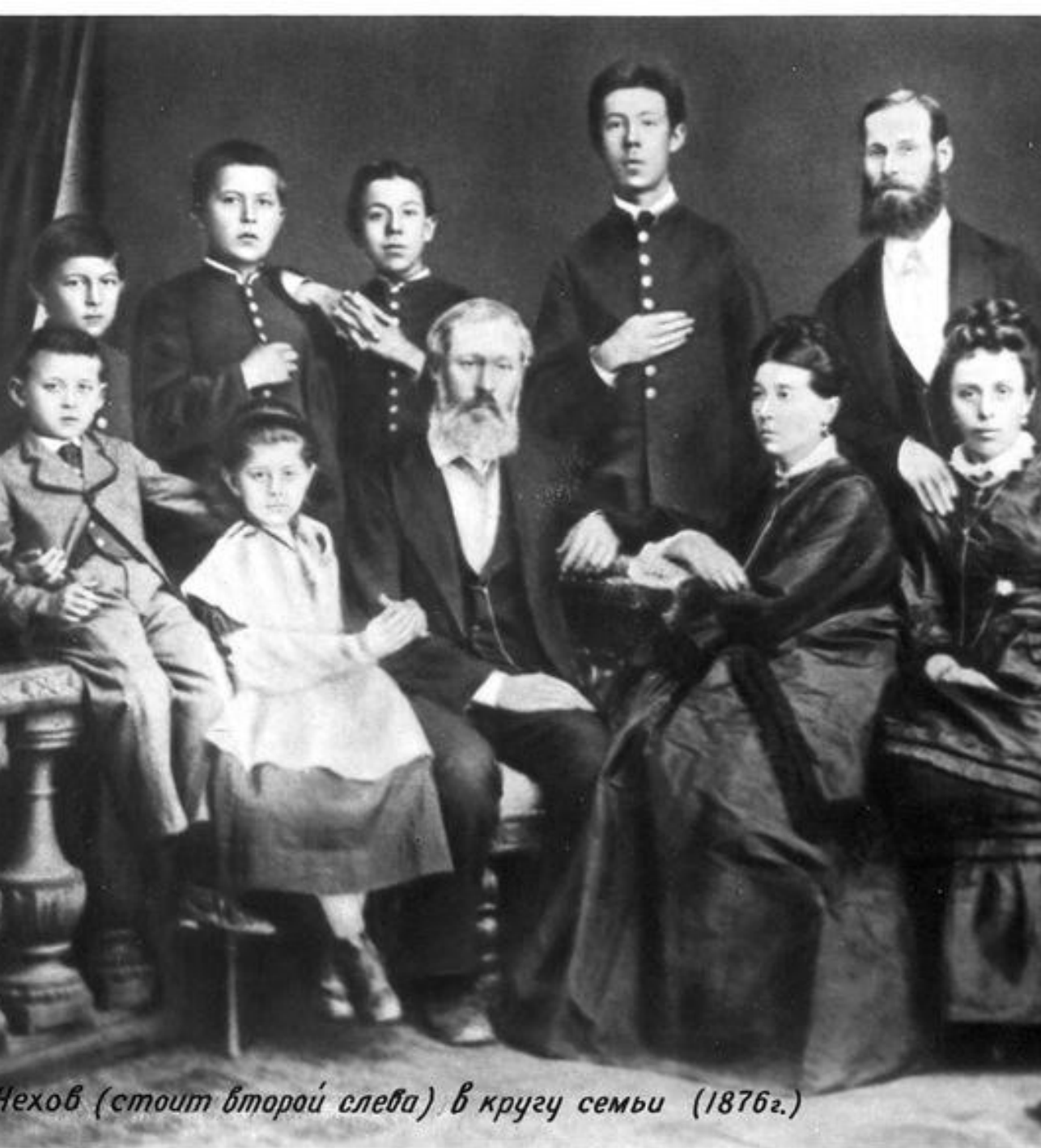
Чехов (стоить другої слева) в кругу семьи (1876г.)

Батько - Павло Єгорович Чехов був вельми цікавою особистістю. Він мав на Таганрозі бакалійну лавку, будучи купцем третьої гільдії, але займався торгівлею без особливого завзяття, більше приділяючи увагу відвідуванню церковних служб, співу і громадських справ. Обстановка в будинку Чехових була традиційно - патріархальною: діти виховувалися в строгості, часто застосовувалися і тілесні покарання, байдикувати нікому не дозволялося .