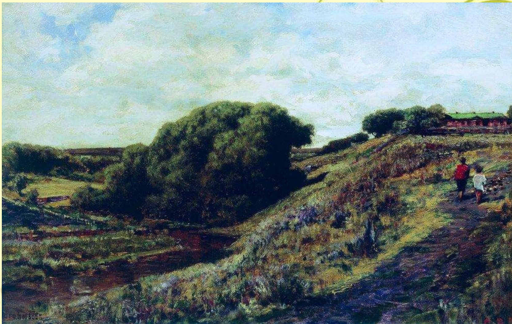
Аблязово. Радищевская усадьба. Овраг. 1887