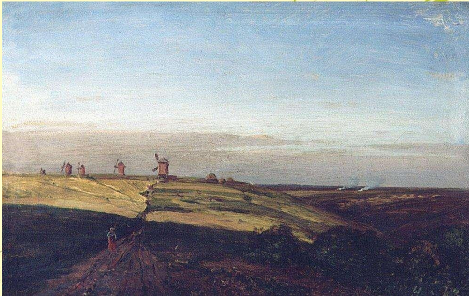
Аблязово. Жниво и мельницы. 1887