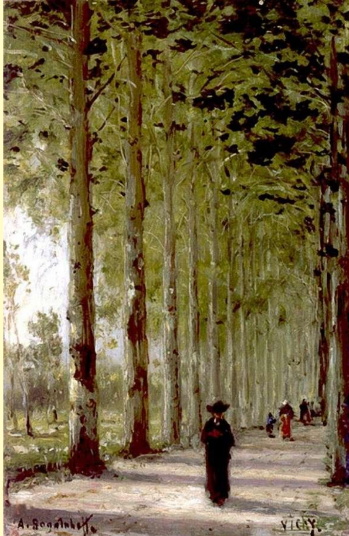
Аллея в Виши. 1870