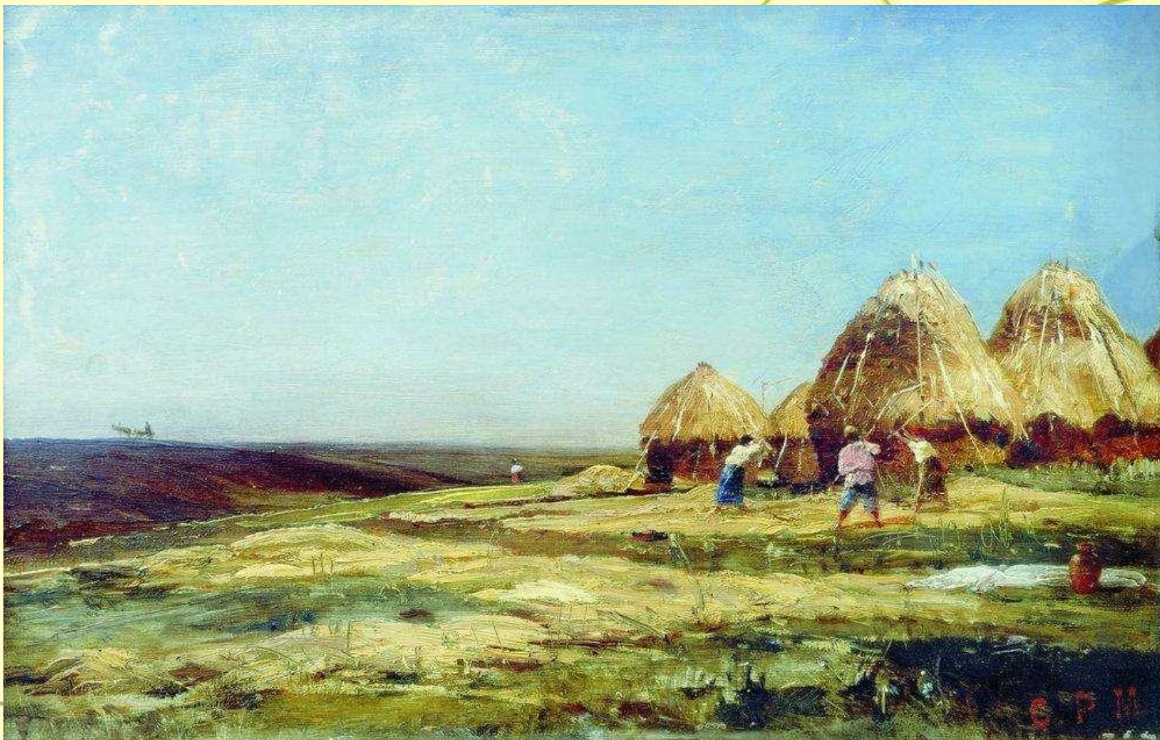
Аблязово. Молотъба. 1887