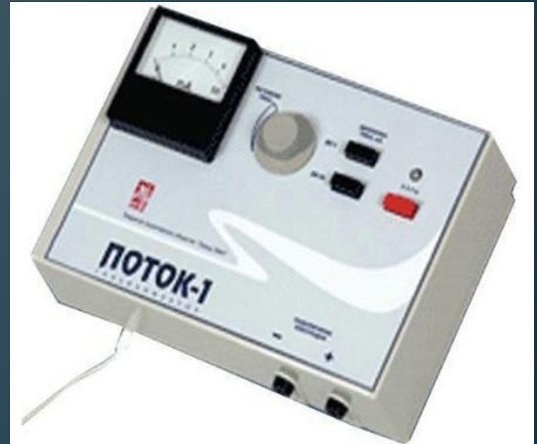
Поток-1" один из самых известных аппаратов гальванизации и электрофореза