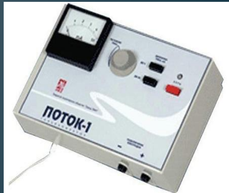
Поток-1" один из самых известных аппаратов гальванизации и электрофореза