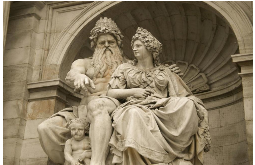
Зевс и Гера