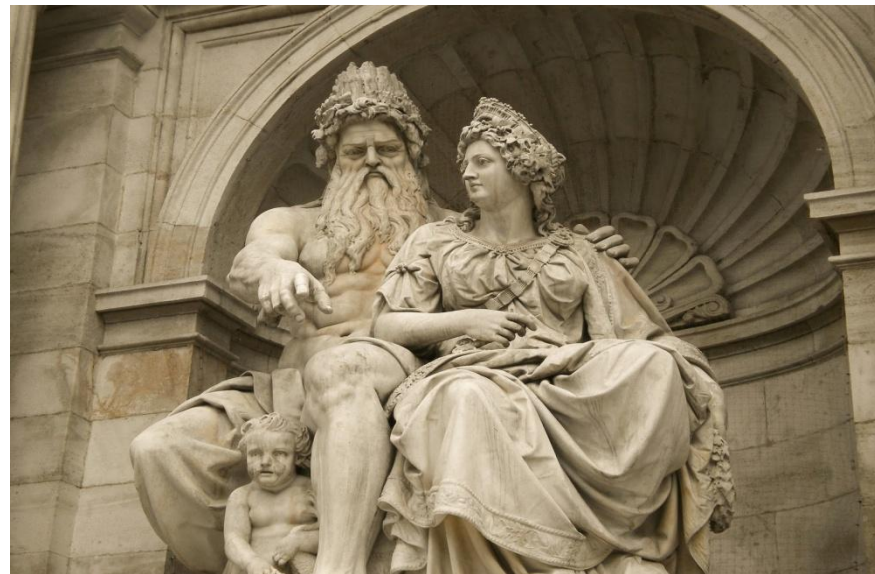
Зевс и Гера