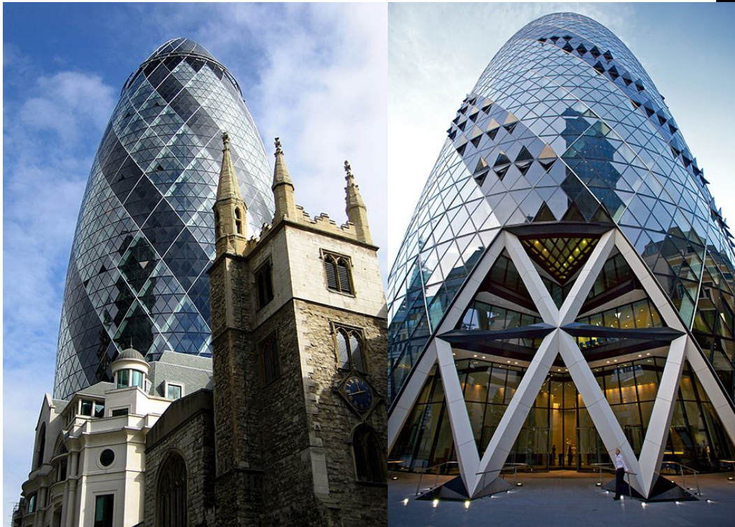
Небоскрёб Мэри-Экс в