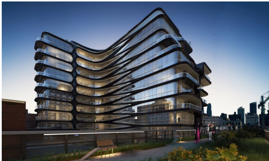
Жилой дом в Манхэттене, США