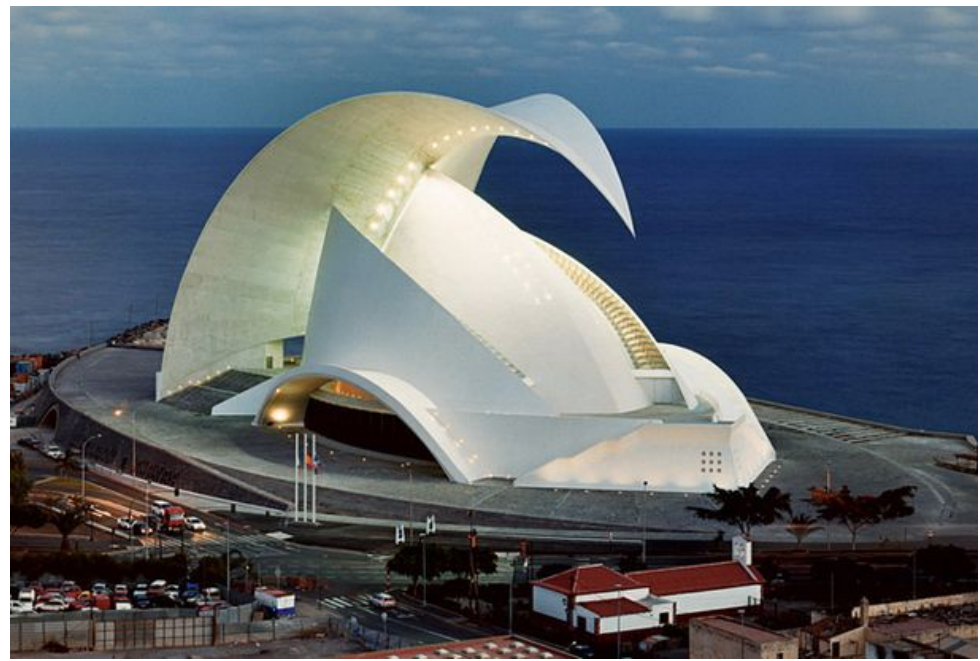
Оперный театр в Санта-Крус

Сантьяго Калатрава Вальс — испанский архитектор и скульптор, автор многих футуристических построек в разных странах мира. Его эстетику иногда определяют как «био-тек»