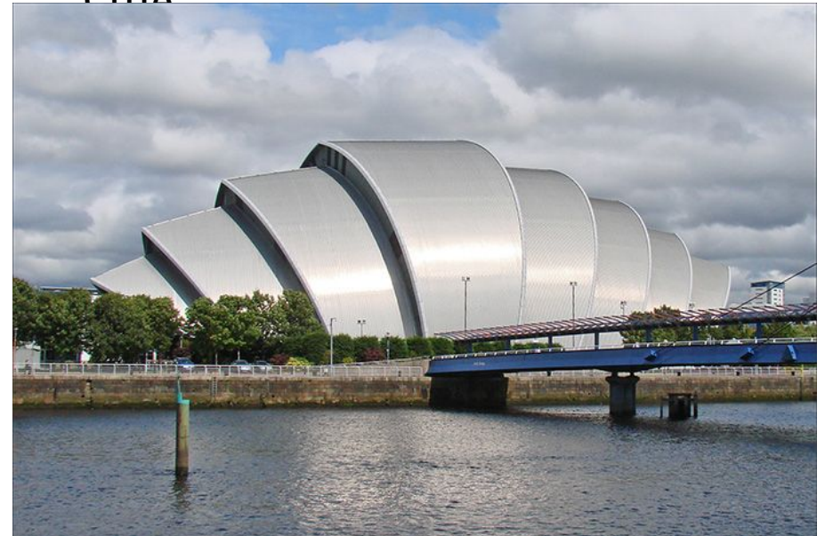
Конференц-зал Клайд Аудиториум в Глазго, Шотландия