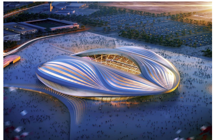
Футбольный стадион 2022, Катар