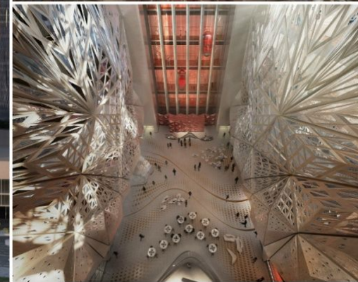
40-этажный отель в Макао,