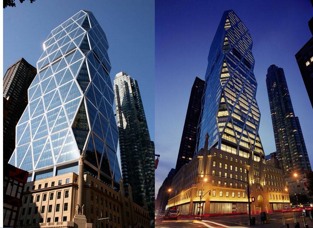
"Херст-тауэр" в Нью-Йорке, США

Норман Фостер — британский архитектор, лауреат Императорской и Притцкеровской премий. Зарубежный почётный член Российской академии художеств.