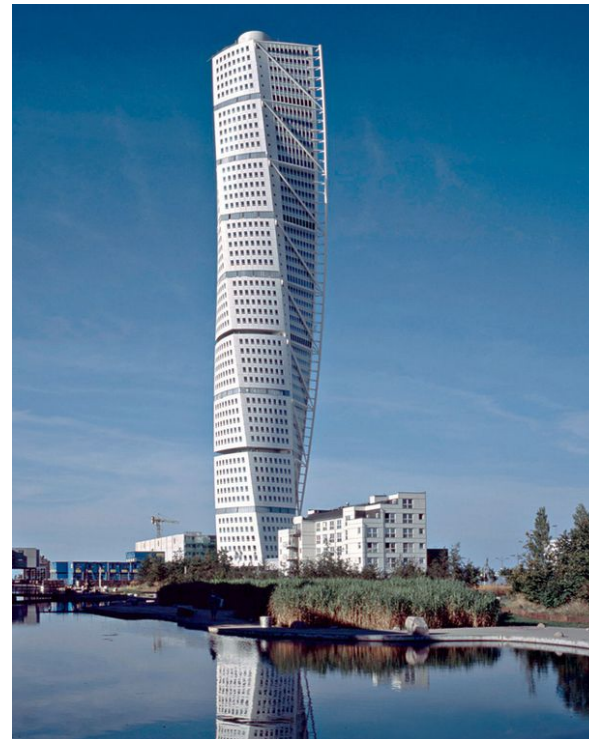
Небоскреб в шведском городе Малмё