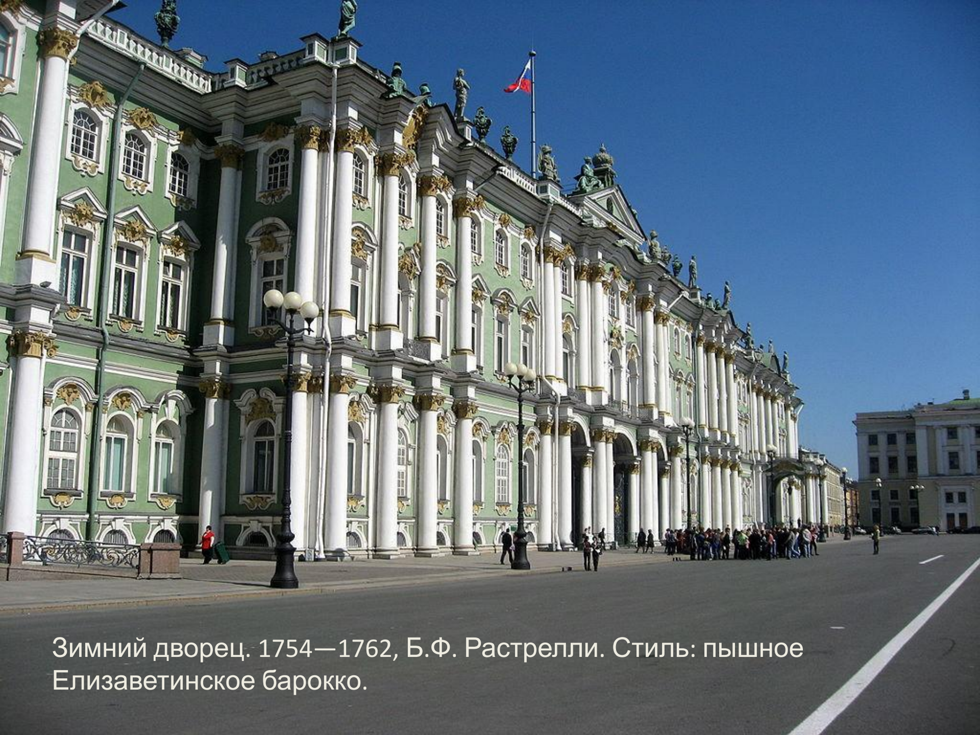
Зимний дворец. 1754—1762, Б.Ф. Растрелли. Стиль: пышное Елизаветинское барокко.