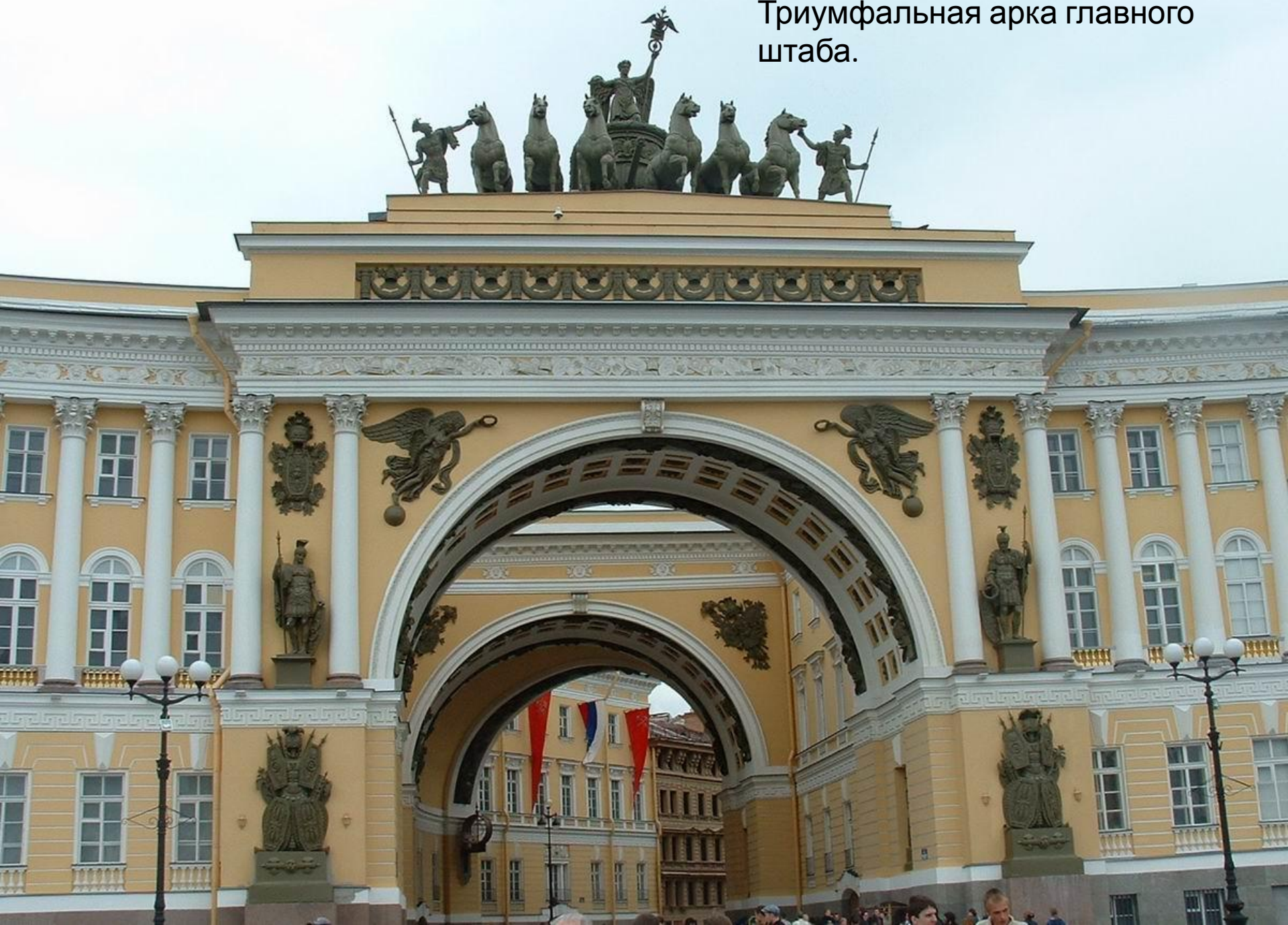
Триумфальная арка главного штаба.