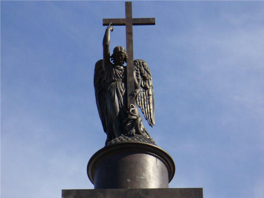
Александровская колонна. 1834, Огюст Монферран. Стиль: ампир.