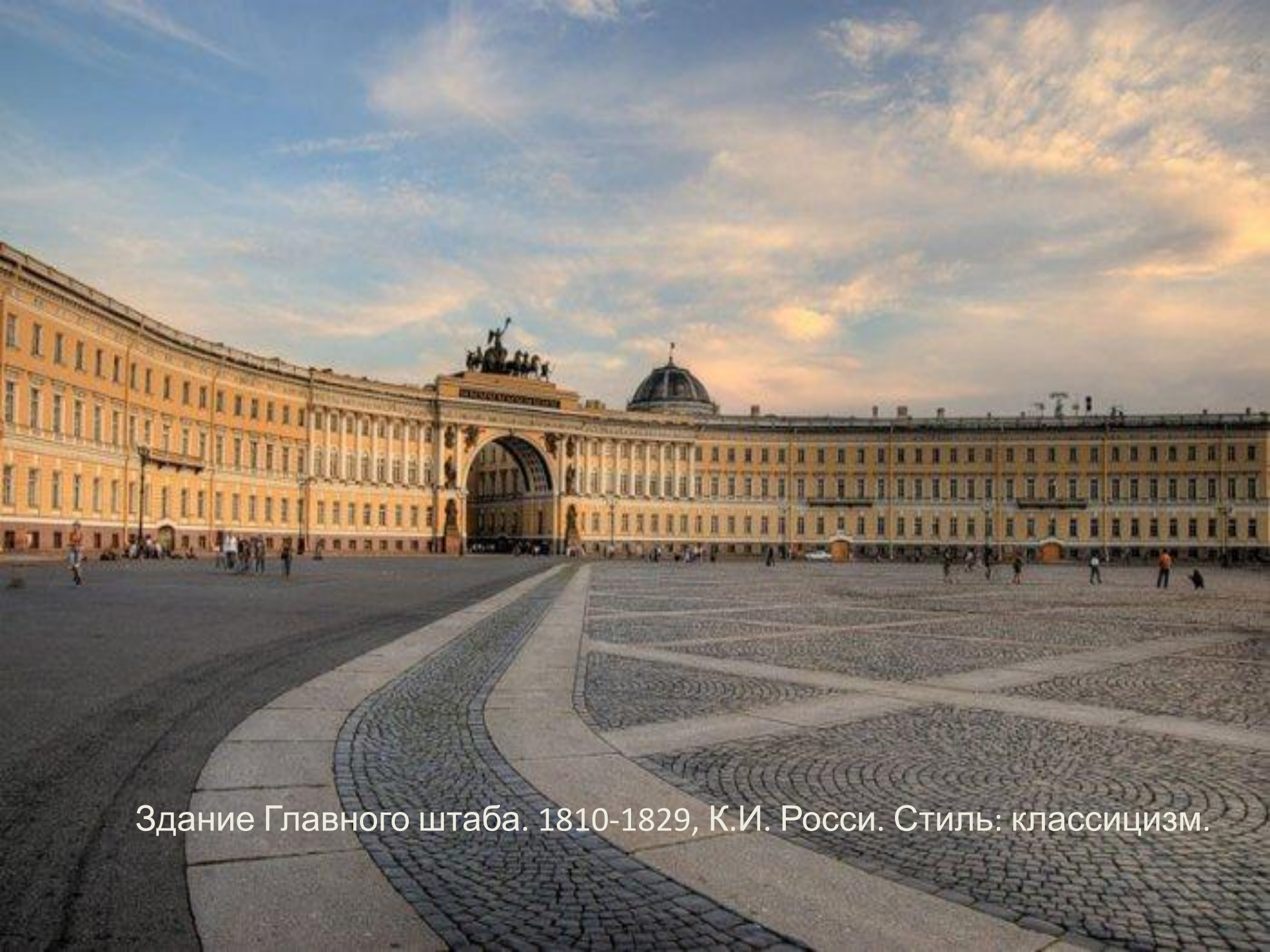
Здание Главного штаба. 1810-1829, К.И. Росси. Стиль: классицизм.