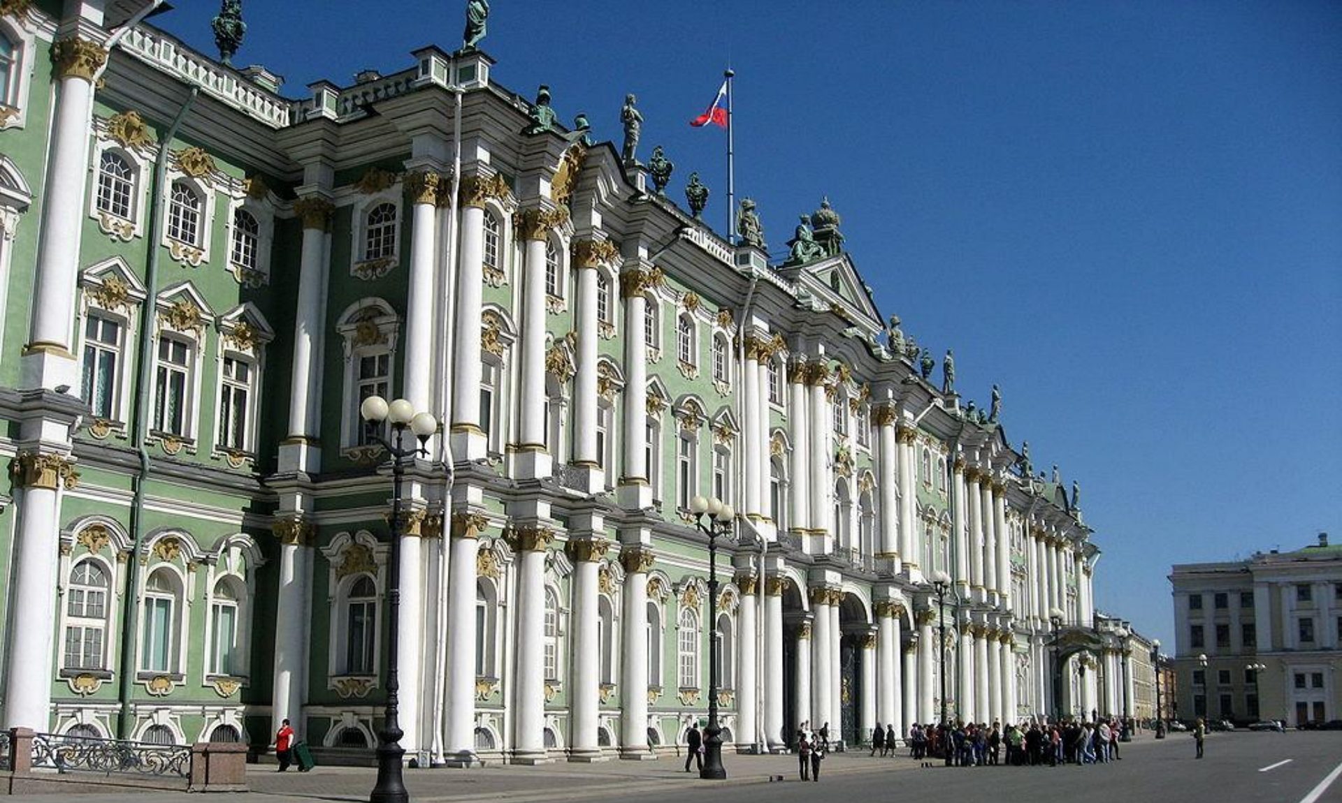
Зимний дворец. 1754—1762, Б.Ф. Растрелли. Стиль: пышное Елизаветинское барокко.