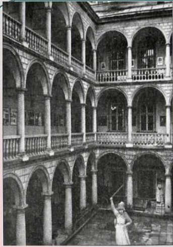
Будинок купця Корнякти у Львові XVI ст. Успенська церква У Львові поч. XVII ст.