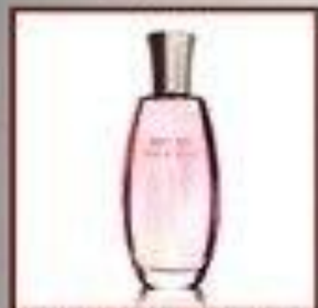
"Мэри Кэй Шрибьют"