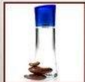
"Велосити для Него"