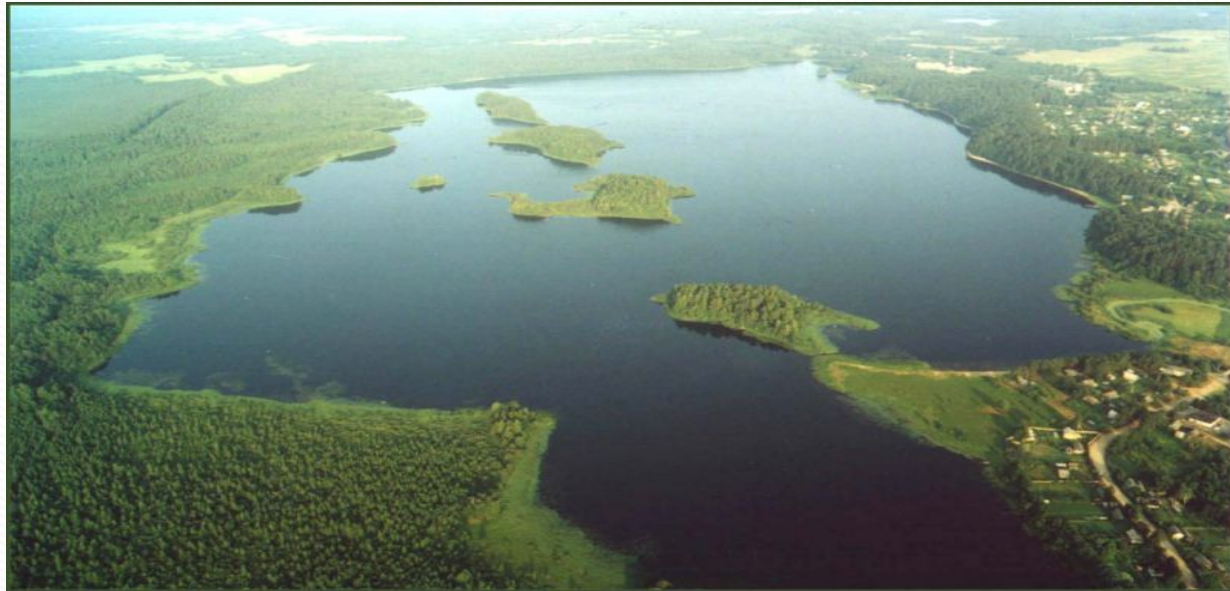
Озеро – Сапшо

Самое красивое озеро – Сапшо. Его площадь – 304 гектара, глубина – 14 метров. По нему с запада на восток протянулось 6 островов.