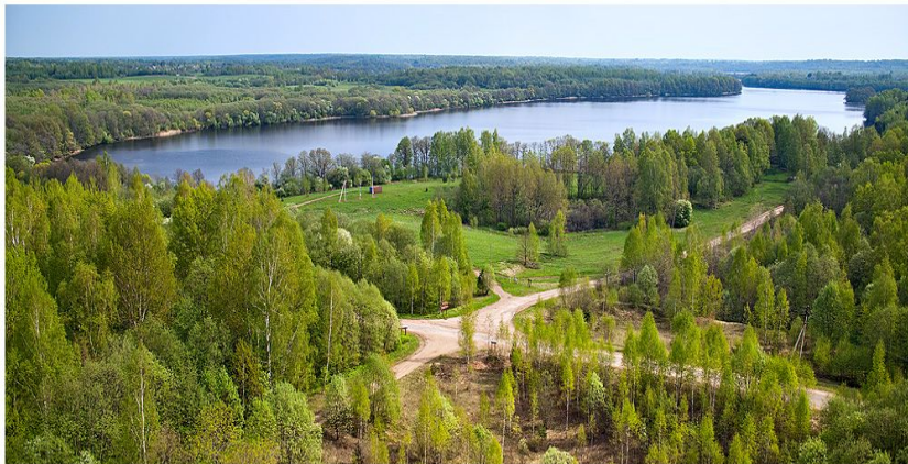
Озеро Баклановское ..

Его глубина – 30 метров, площадь – 221 гектар. Форма озера напоминает букву «Н», это как бы два озера соединённых в одно.