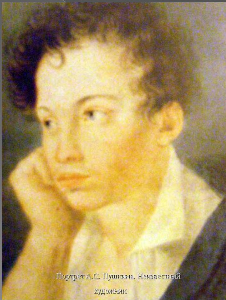
Портрет А.С. Пушкина. Неизвестный художник.

«Чудесный талант! Какие стихи! Он мучит меня своим даром, как приведение!» В. Жуковский