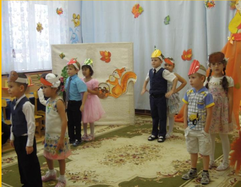
Танец овощей (маски)