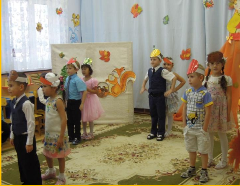
Танец овощей (маски)