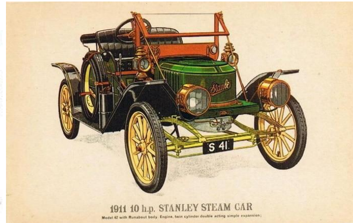
1911 10 h.p. STANLEY STEAM CAR Model 62 with Runabout body. Engine, twin cylinder double acting simple expansion.