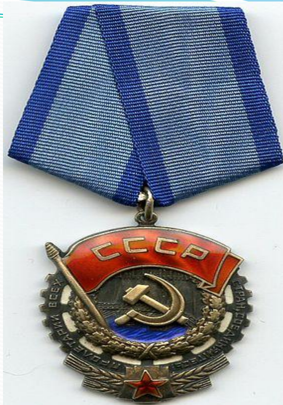
Еңбек Қызыл Ту орденімен