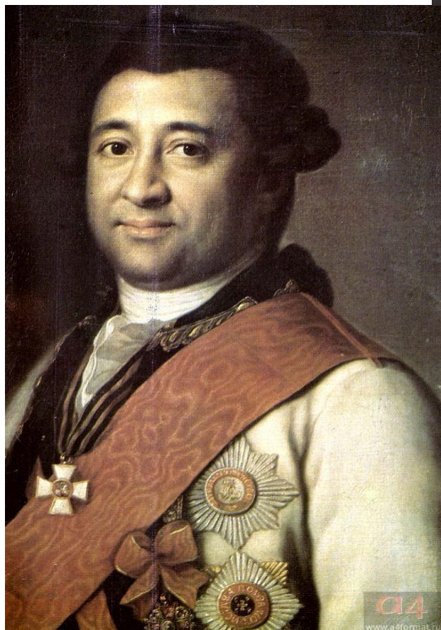
Дедушка Александра Сергеевича Пушкина