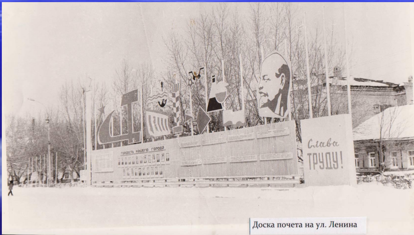
Доска почета на ул. Ленина