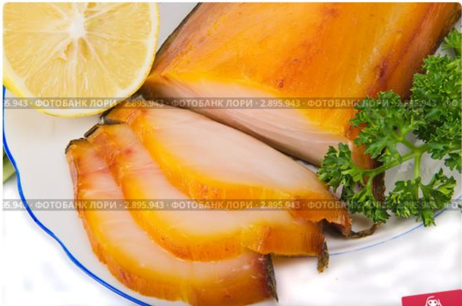
Копченый балык с зеленью