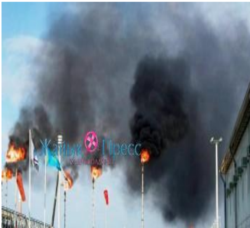
Қарашығанақ Петролеум Оперейтинг