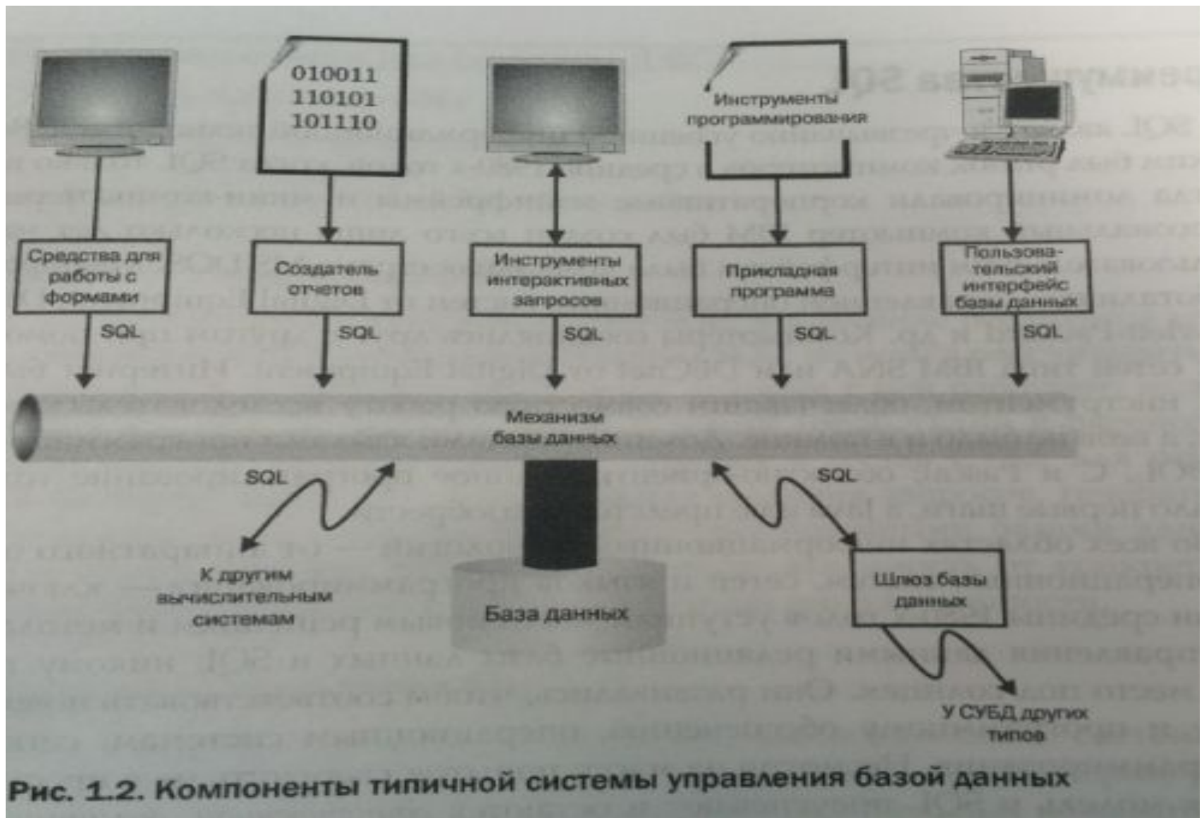
Рис. 1.2. Компоненты типичной системы управления базой данных