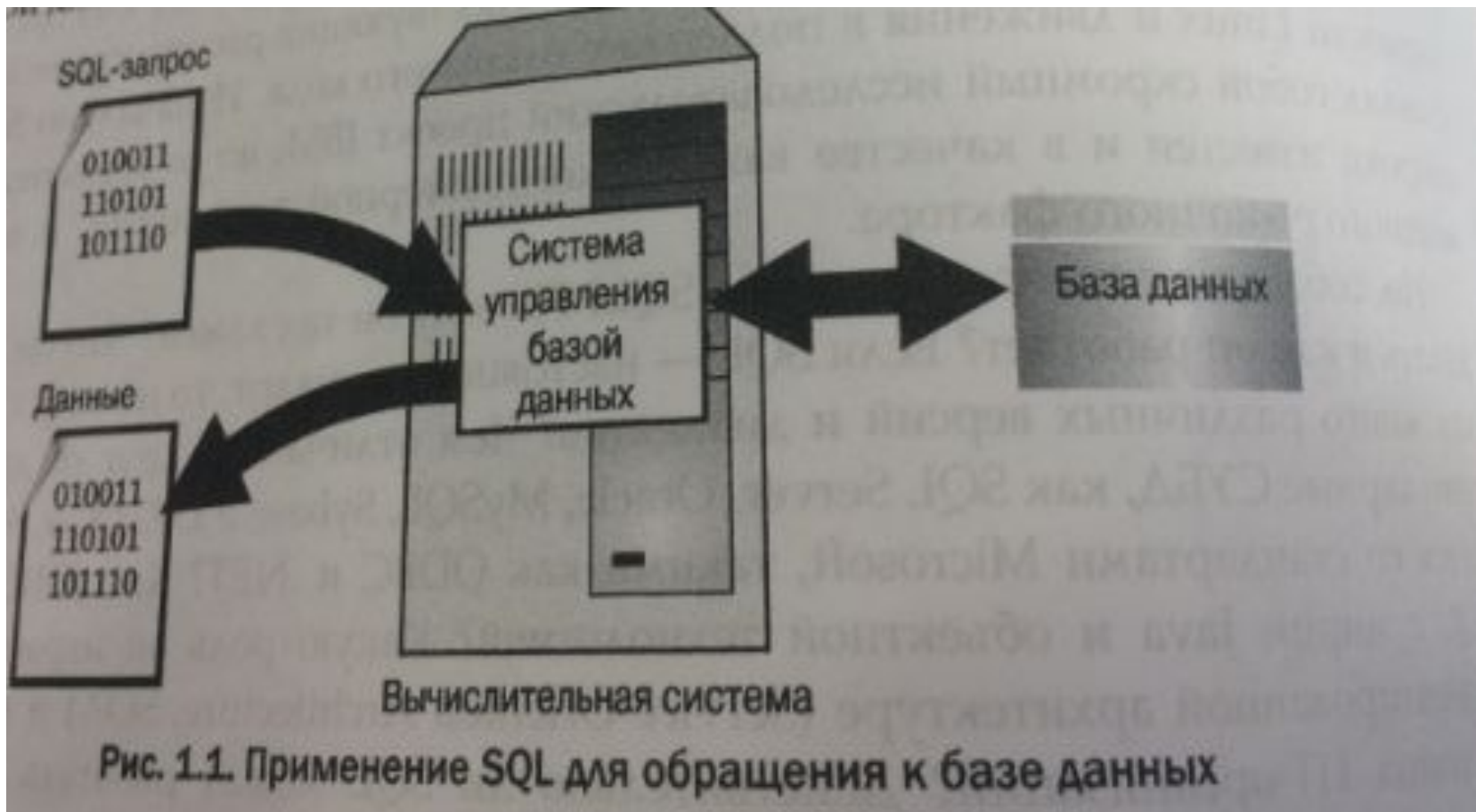
Рис. 1.1. Применение SQL для обращения к базе данных